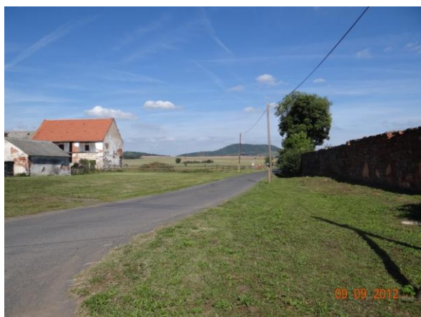
Konec krytého profilu pod obcí.