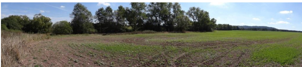
Sběrná plocha přímo nad obcí.