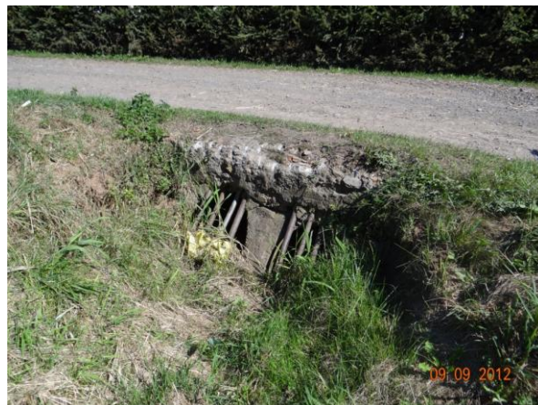
Nátok do krytého profilu - jednoznačně nekapacitní profil.