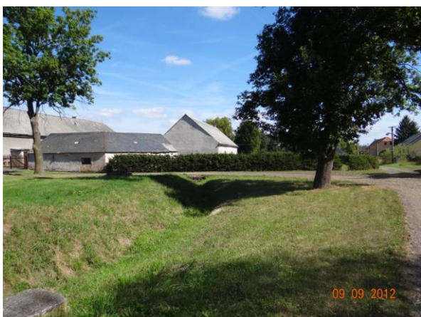
Koryto nad krytým profilem.