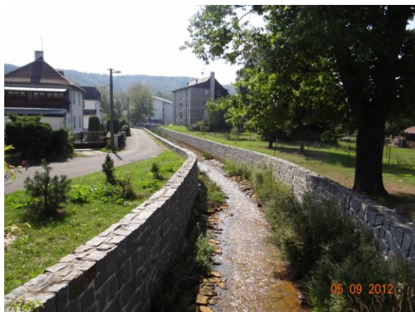
Koryto v dolních Loučkách.