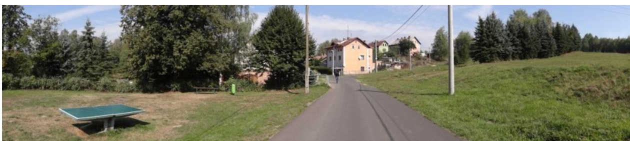
Celkový pohled na nivu u hřiště. Vpravo hráz rekonstruovaných nádrží.