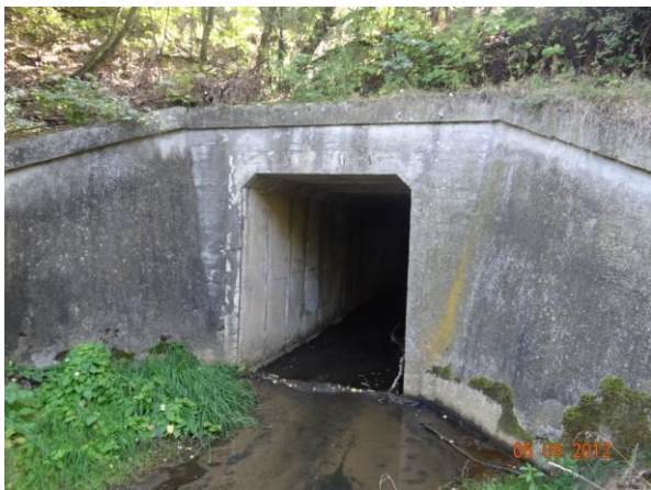
Nátok do krytého profilu pod Nádražím v Novém Sedle - limitující profil pro průtok v Loučkách.