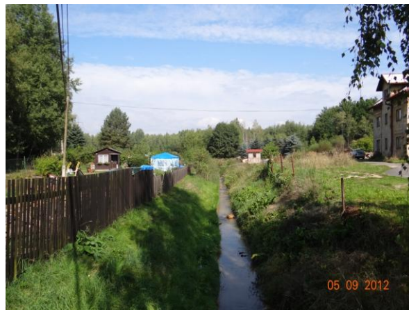
Koryta v místě kritického bodu - dojde k ohrožení obytných a rekreačních objektů.