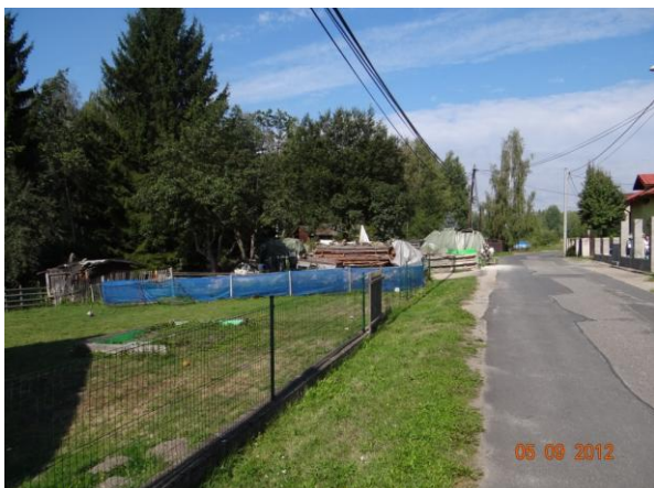
Ze zahrad může dojít ke splavení materiálu.