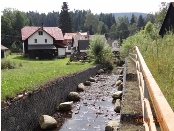
Regulované koryto s gabionovými kaši a matracemi.