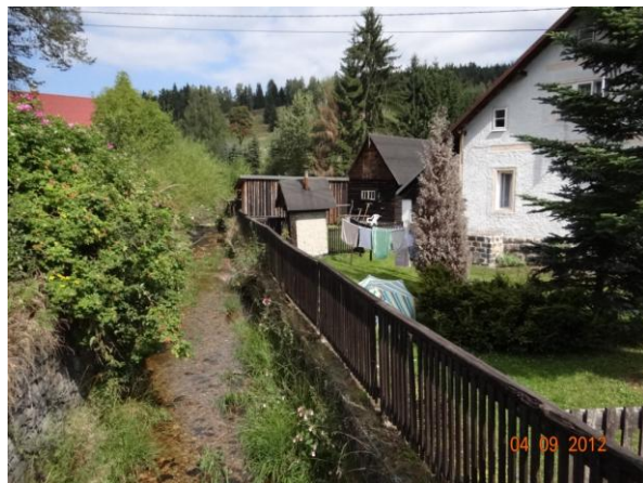
Koryto toku v centru Nových Hamrů.