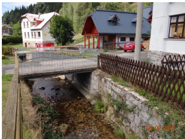
Ploty a lávky mohou způsobit kumulaci komplikací.