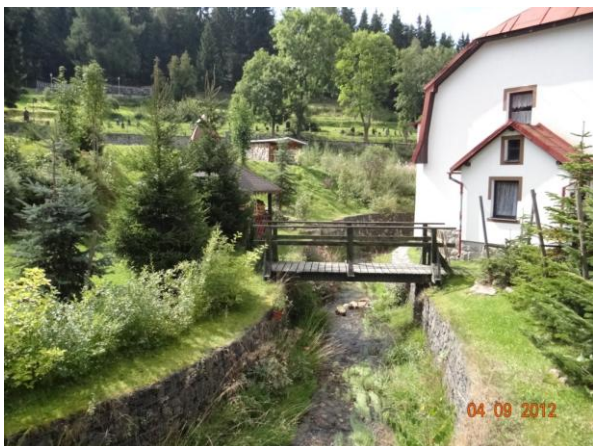
Situaci zkomplikuje řada mostů a lávek.