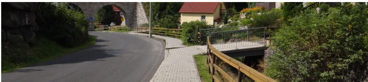
Celkový pohled na ohroženou dolní část Nových Hamrů.