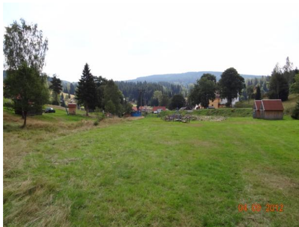
Ohrožená lokalita dojezdu sjezdovek.