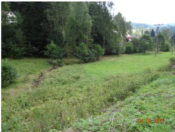
Tok Bílého potoka nad sjezdovkami.