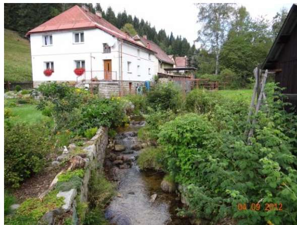
Ohrožené nemovitosti č.p. 347, 342.