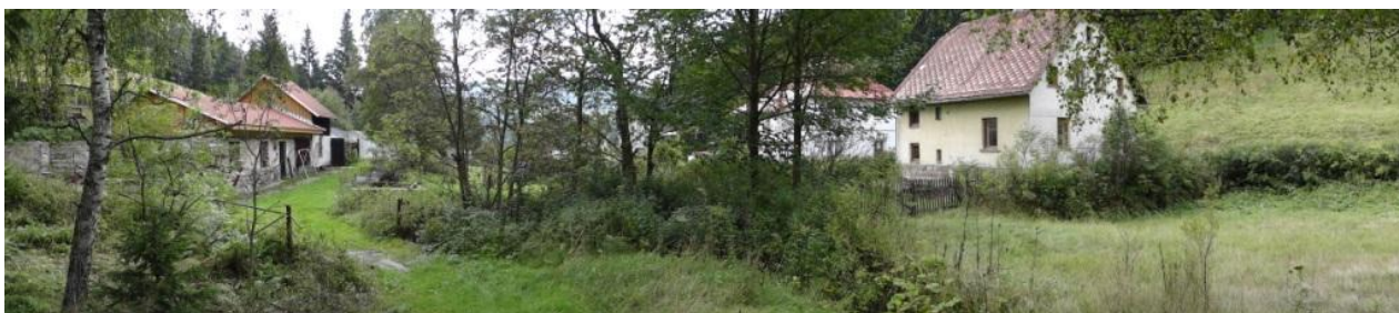
Ohrožená lokalita u č.p.347 a 305.