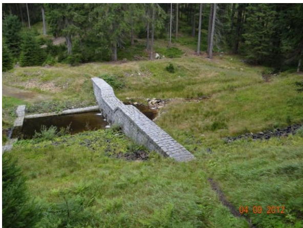
Štěrková přehrážka nad Novými Hamry.