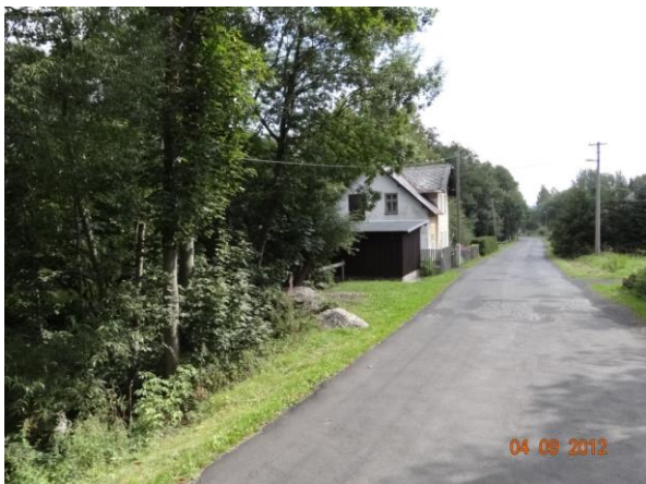
Ohrožená bude komunikace i rodinné domy.