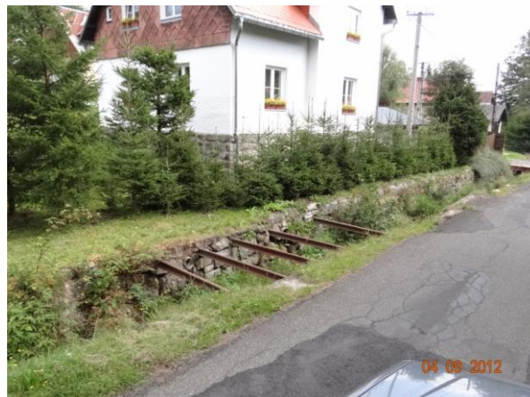
Situaci zkomplikují ocelové profily v toku.