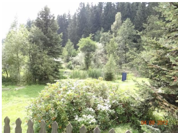
Koryto toku v dolní části Vysoké Pece.