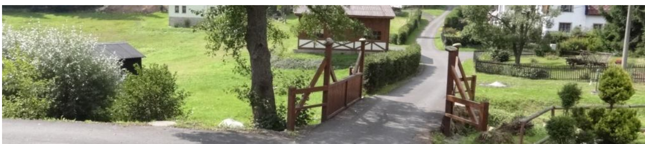
Lávka v Centru Vysoké Pece - místo rozlivu.