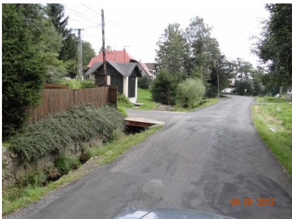
Nekapacitní budou mostky a lávky k nemovitostem.