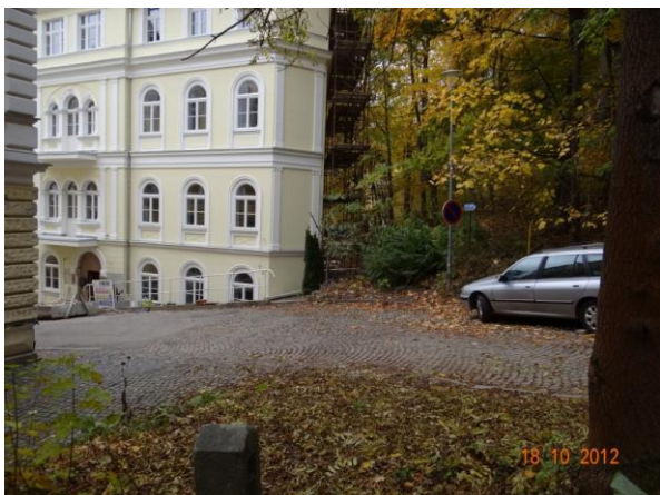
Mostek nad ZUŠ u hotelu.