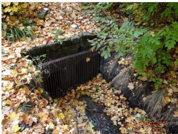
Nátok do krytého profilu u ZUŠ.