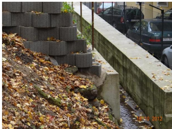
Koryto nad ZUŠ.