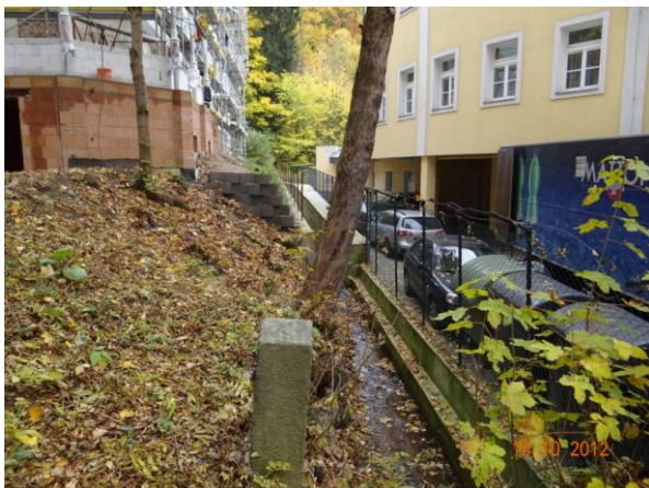
Velmi úzké koryto mezi hotely č.p. 190 a 92.