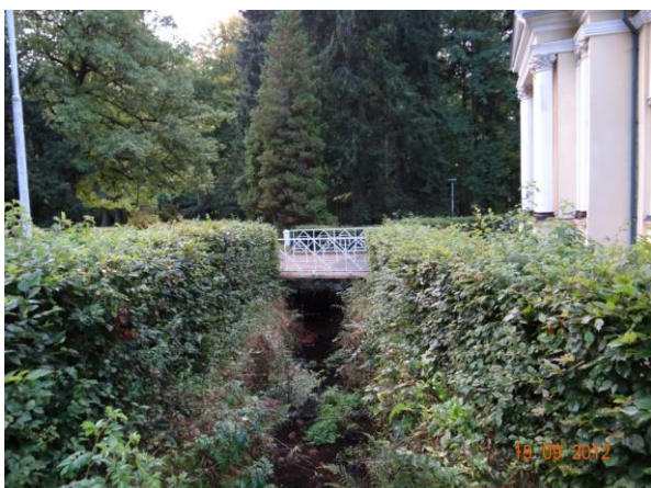
Lázeňská zóna - úsek parku (živé ploty lemují koryto).