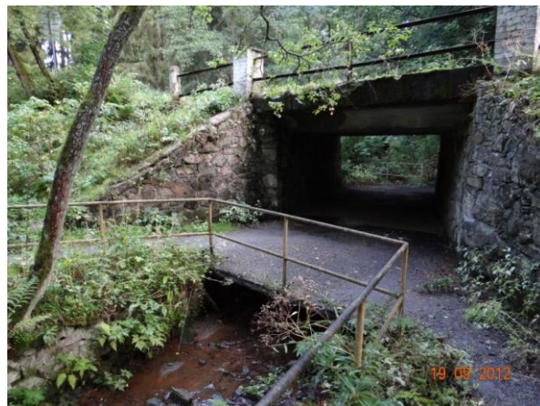
Most 2117-2 s lávkou - omezující profil pod soutokem Třebízského a Ušovického potoka.