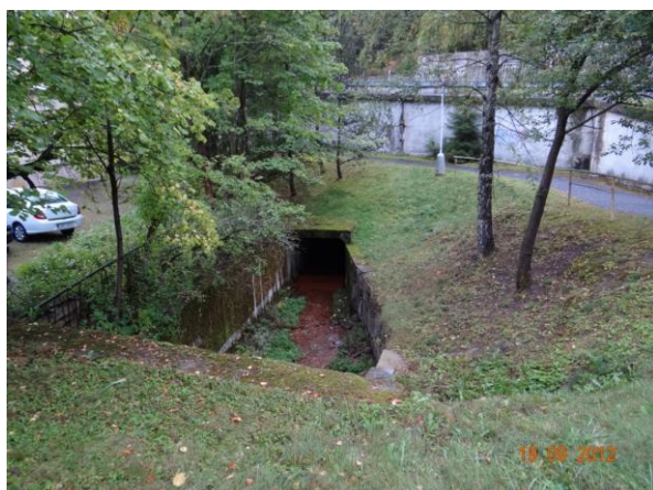
Nátok do krytého profilu.