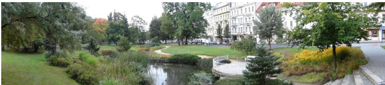
Pohled na část hlavní třídy lázeňské zóny.