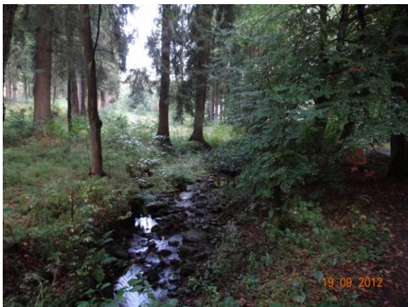
Koryto toku nad kritickým bodem.