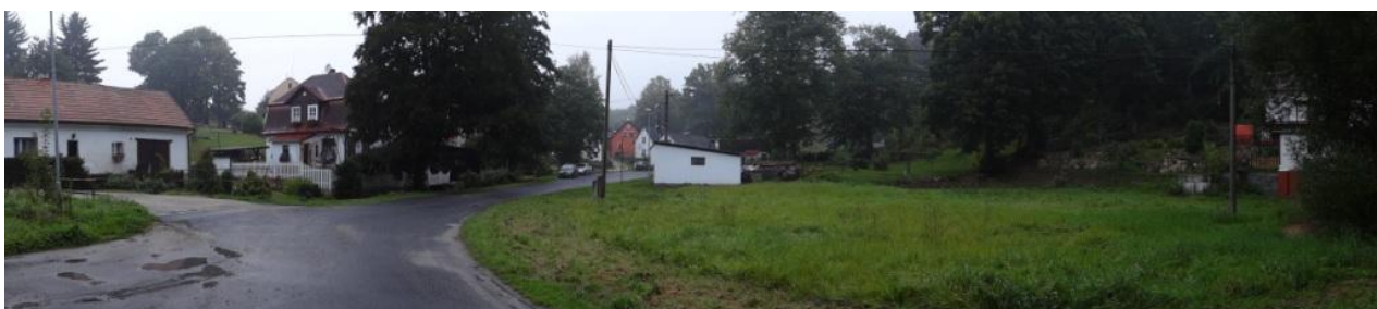
Celkový pohled na ohroženou náves.