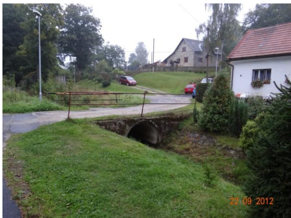
Trubní propust pod č.p. 5.