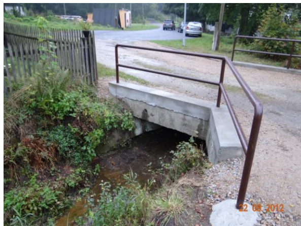
Nekapacitní most pod objektem č.p.4.