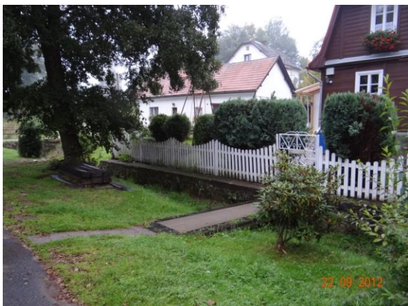
Ohrožené objekty č.p.36 a 5.