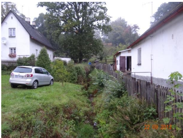
Koryto podél objektu č.p. 4.