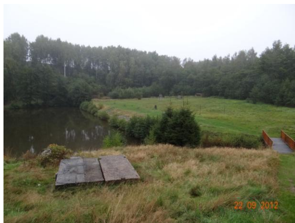
Přepad z lomu.