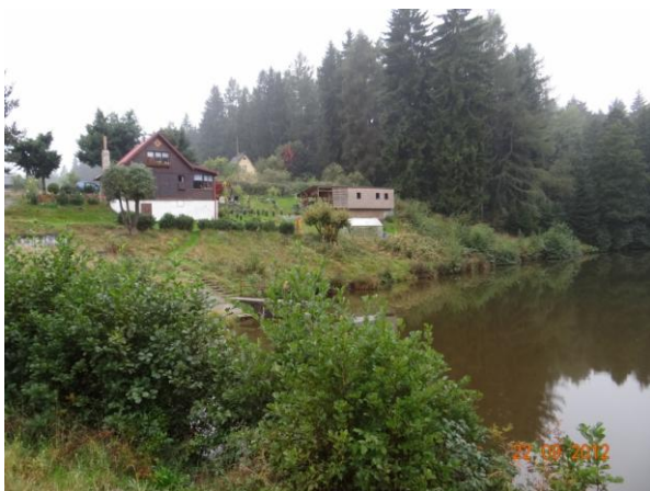
Rekreační objekty u zatopeného lomu.