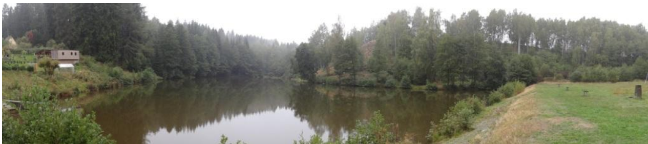
Celkový pohled na zatopený lom.