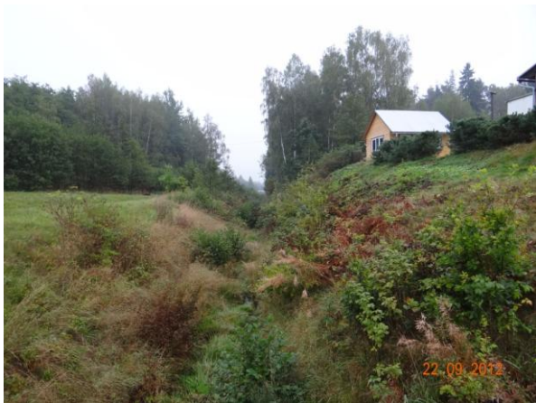
Koryto nad pilou Herkules.