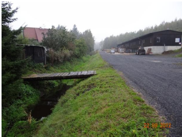
Koryto v areálu pily Herkules. Řezivo skladováno mimo potenciální rozliv.