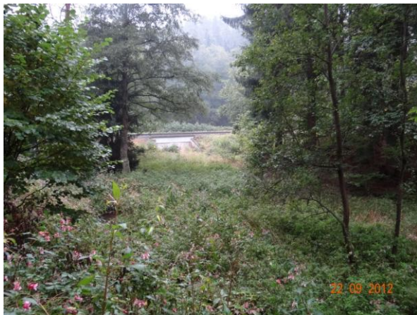
Dolínský potok nad železniční tratí.