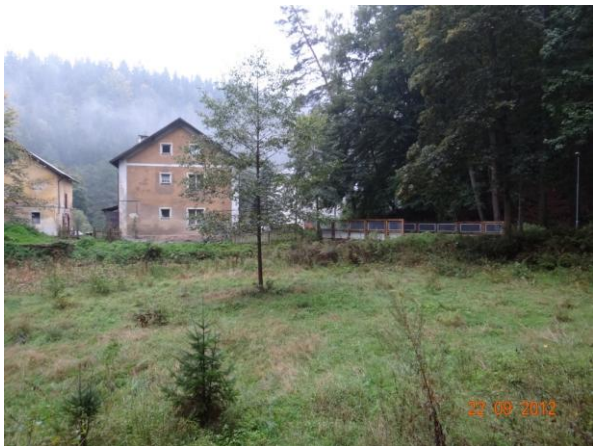
Objekty č.p. 27 a 30 ohrožené při vzdutí podél železniční trati.