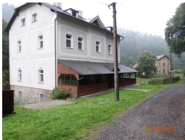
Ohrožený objekt č.p. 28.