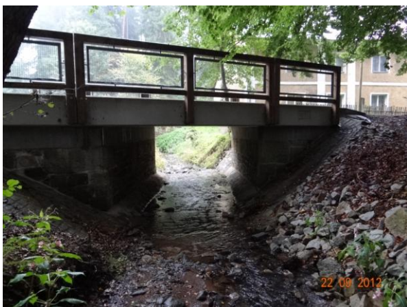
Rekonstruovaný most 21030 a-2 v Hřebenech.