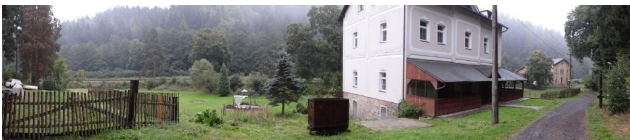
Celkový pohled na ohroženou lokalitu u č.p.28.