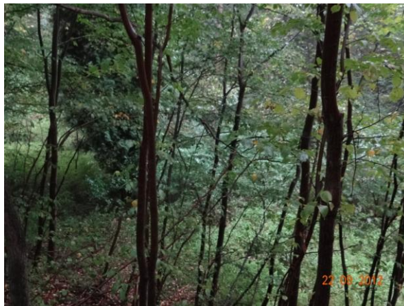
Koryto toku pod kritickým bodem.