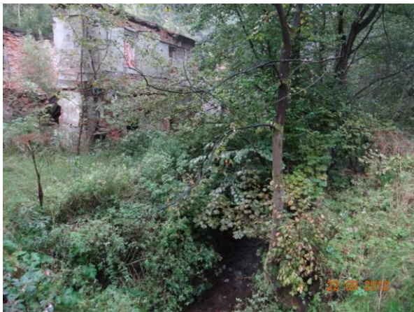
Objekt č.p. 7 nad kritickým bodem.