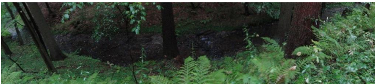
Hluboké údolí toku pod cihelnou a č.p.7.