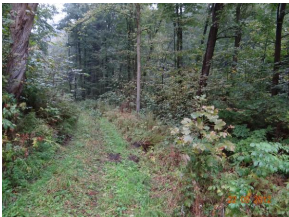
Koryto toku nad rozbořenou cihelnou.