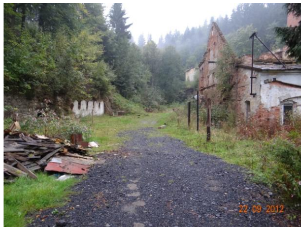
Areál bývalé cihelny.