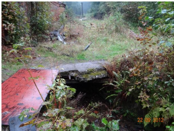
Krytý profil nad mostem v cihelně.