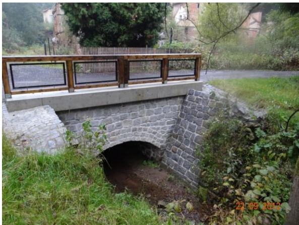
Nově rekonstruovaný most 21030 a-1.