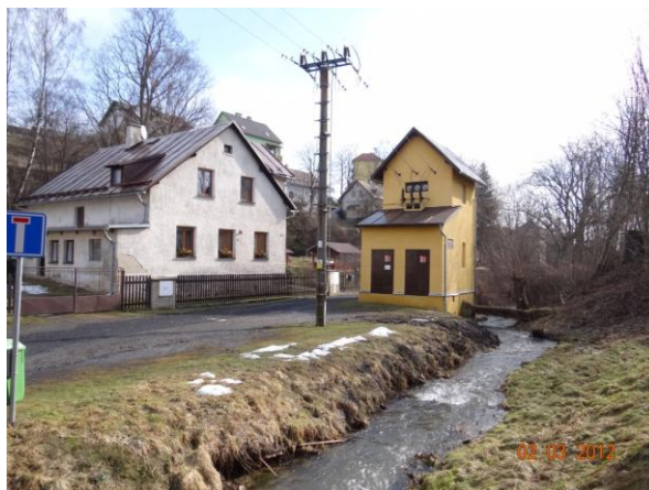
Ohrožená je i trafostanice.