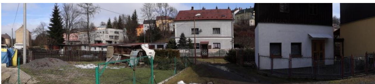
Ohrožená lokalita u č.p.454 a 47.