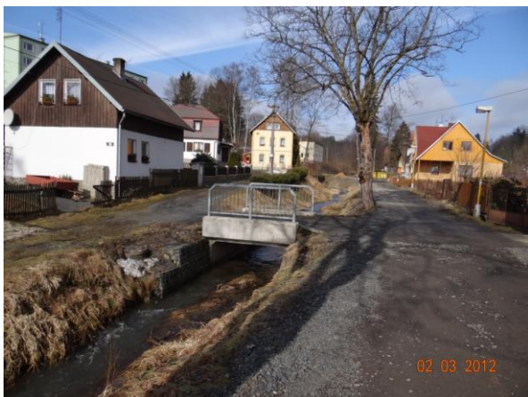
Situaci zkomplikuje řada mostů a lávek.