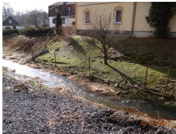
Ploty podél koryta v obci.