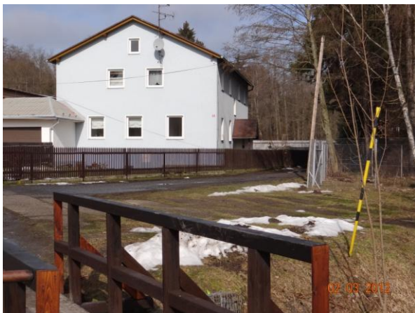
Ohrožený objekt nástrojárny (č.p.57).