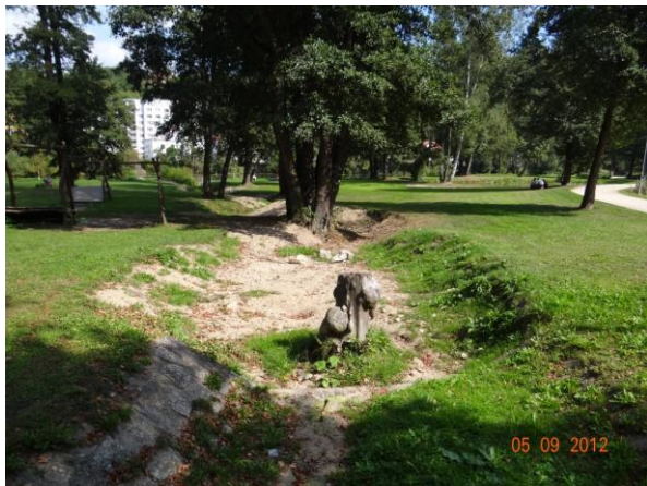
Koryto potoka v parku pod lávkou,