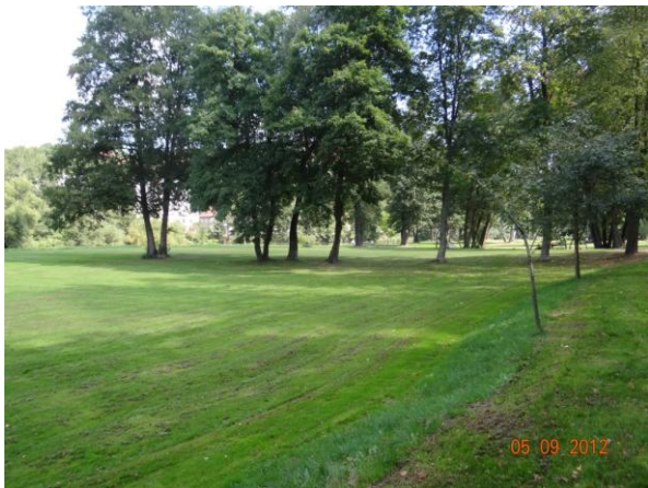
Park (plochá niva Ohře).