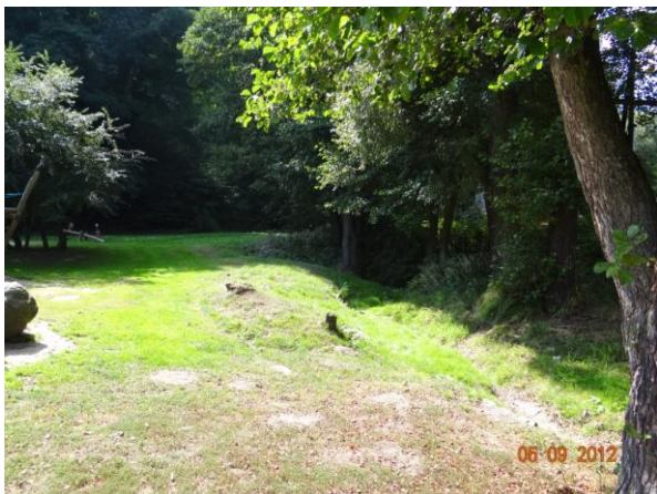
Koryto Supího potoka v parku nad lávkou.