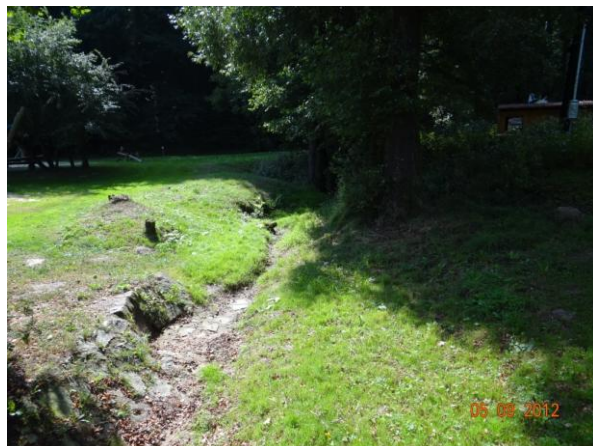
Koryto Supího potoka v parku nad lávkou.