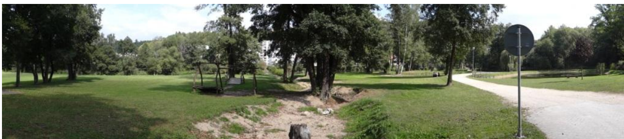
Celkový pohled na ohroženou část parku.