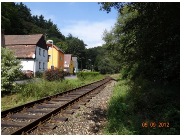
Ohroženo těleso dráhy a rodinné domy.