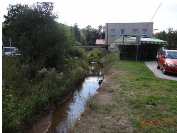
Koryto pod krytým profilem.