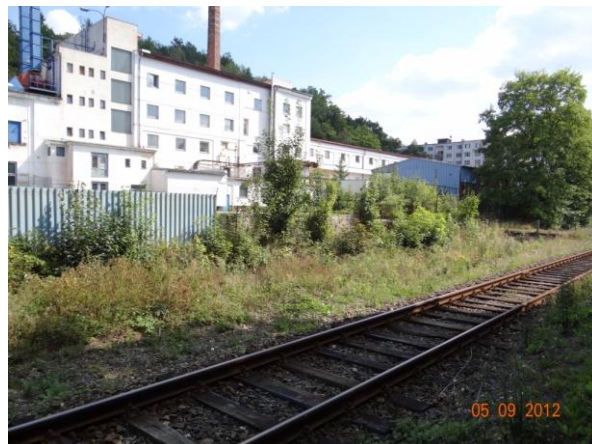
Ohrožený areál mrazíren a dalších služeb.