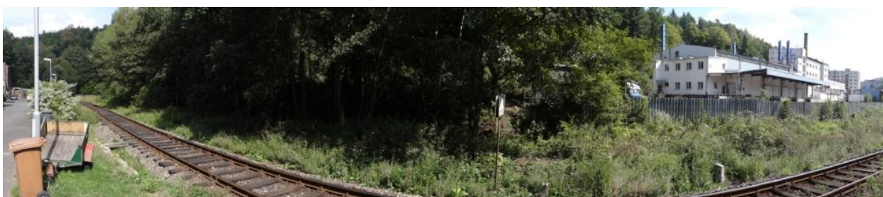
Celkový pohled na ohroženou lokalitu mrazíren a železniční trati.