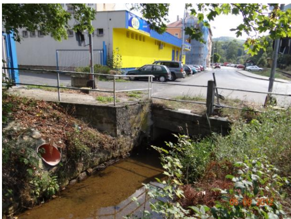
Nátok do krytého profilu - kritický profil pro rozliv u mrazíren.