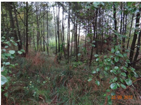
Koryto toku podél in-line dráhy.