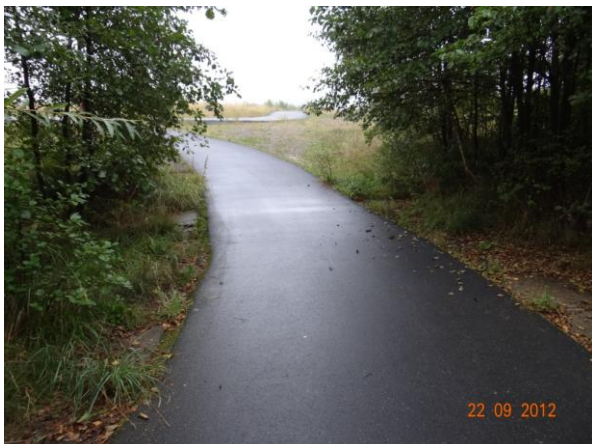
Chodník od parkoviště k in-line dráze v místě křížení s Částkovským potokem.