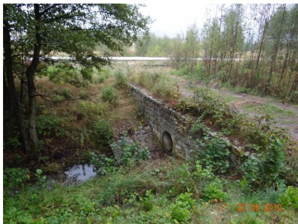
Prozatímní příjezdová cesta k parkovišti.