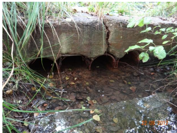
Trubní nekapacitní propustek v tělese chodníku.