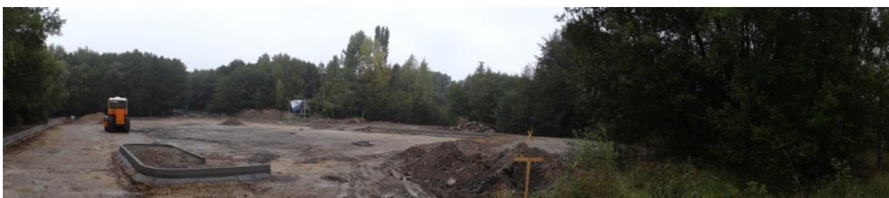
Celkový pohled na nově budované parkoviště k in-line dráze.