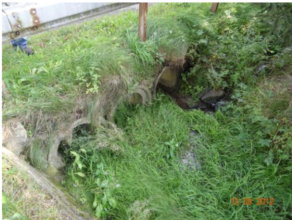
Trubní propusti v komunikaci pod č.p.14.