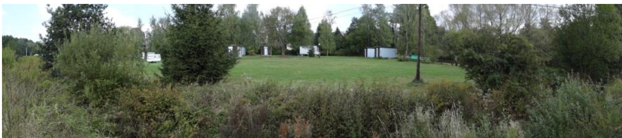
Ohrožený rekreační areál na PB Stebnického potoka.