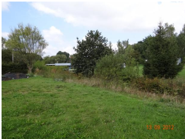
Ústí toku do Stebnického potoka.