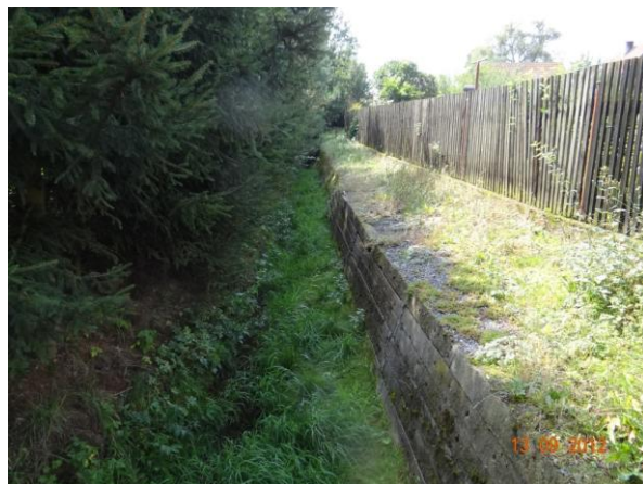
Koryto toku podél č.p. 14.