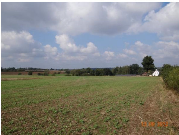
Sběrná plocha nad obcí.