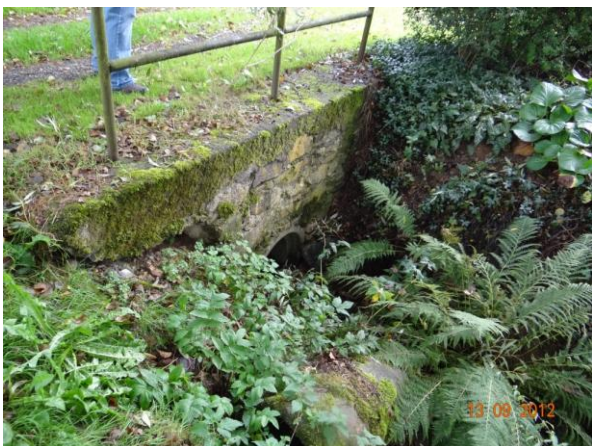
Nekapacitní trubní propust v cestě.