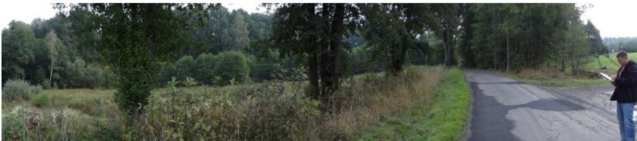
Sběrná plocha nad Kozly.