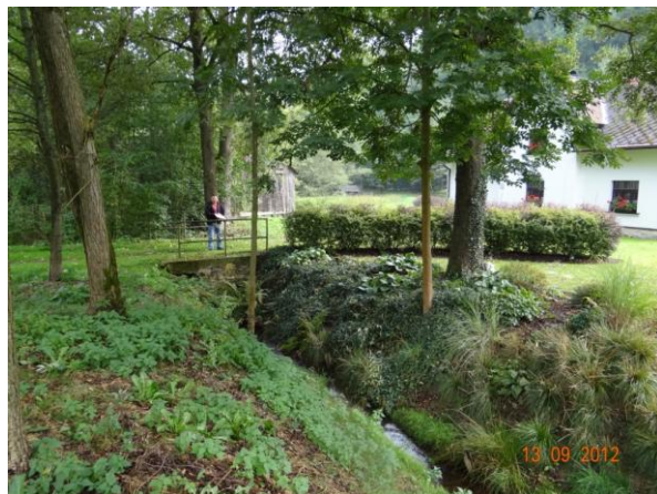
Příjezd k ohrožené nemovitosti č.p. 22.