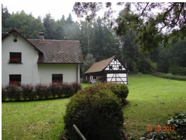
Ohrožená nemovitost č.p. 22.