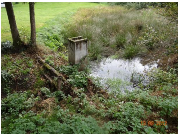
Destruovaná hráz a zbytky opevnění nádrže nad č.p. 22.