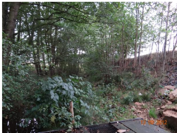
Koryto toku Kozelského potoka podél rybníku.