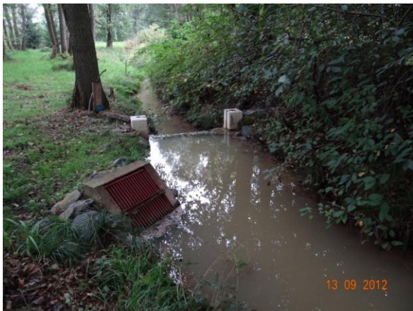
Odběrný objekt k rybníčkům.