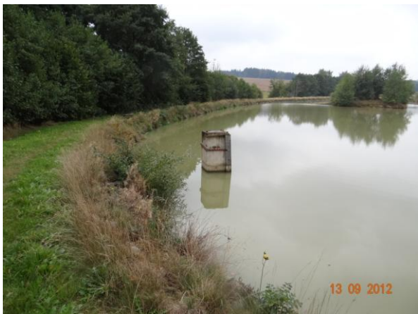
Rybník v Horní Lipině.