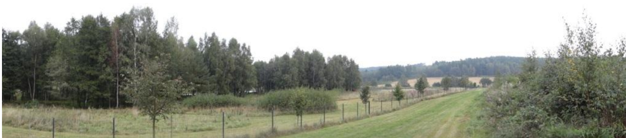
Rybníkářský areál na Kozelském potoce pod obcí.