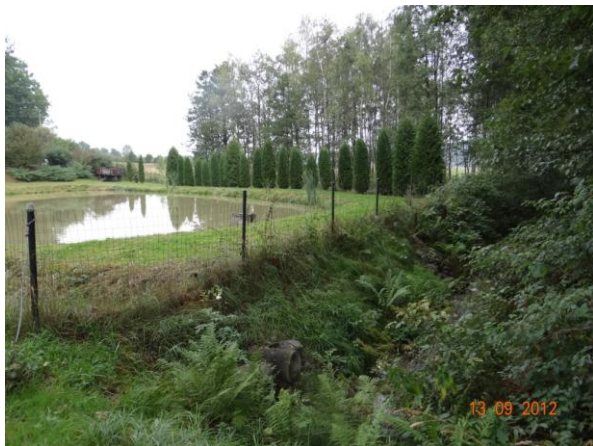
Rybníky pod č.p. 5.