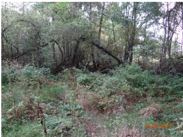
Neudržované koryto nad kritickým bodem.