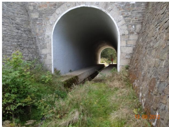
Kapacitní železniční viadukt.