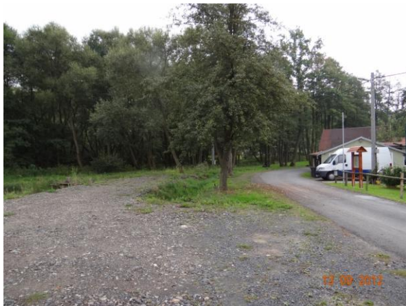
Pohled proti vodě k č.p. 8 a 4. nudou ohroženy prouděním od mostu.