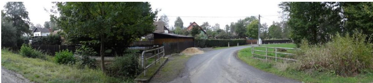
Celkový pohled na ohroženou lokalitu.