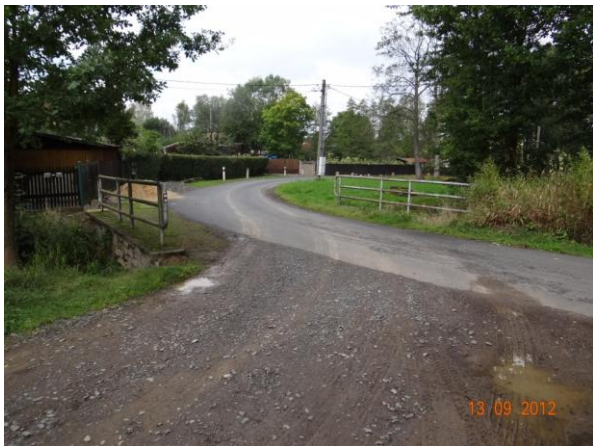
Most na Paličském potoce v ř.km 1 - místo rozlivu.