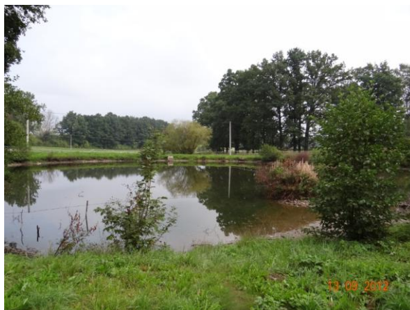
Rybník v Doubravě.