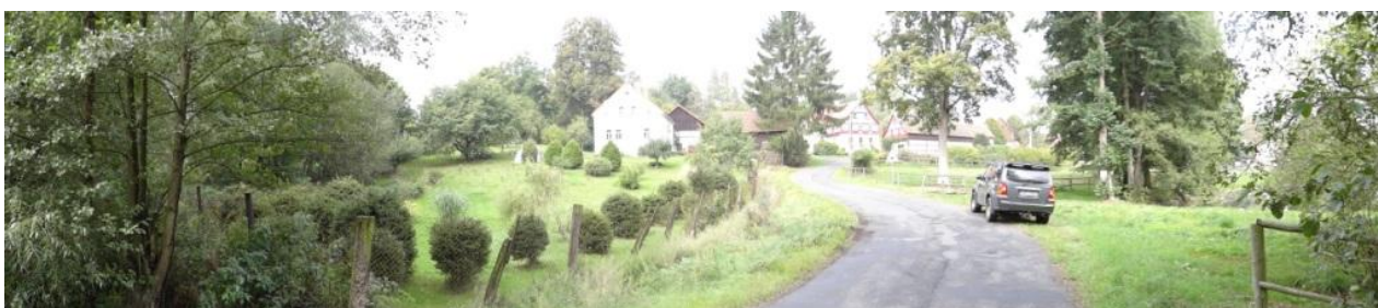
Celkový pohled na křížení toku s komunikací v Doubravě.