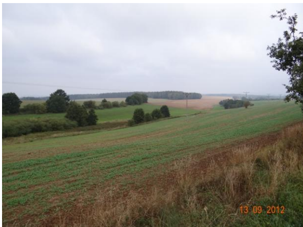
Sběrná plocha nad obcí.