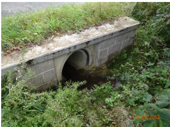
Trubní propust nad rybníkem.