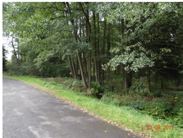
Niva toku v Doubravě.