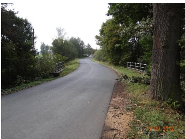
Most 21413-1 u č.p. 4.