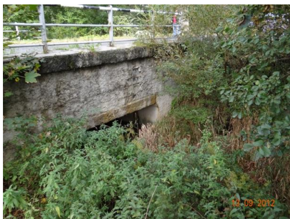
Detail mostu 21413-1.