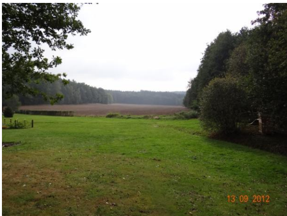
Sběrná plocha nad č.p. 16.