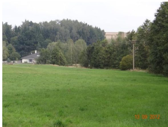
Pohled od kritického bodu k ohroženému objektu č.p. 4.