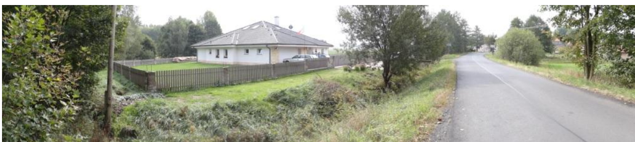
Ohrožený objekt č.p. 4.