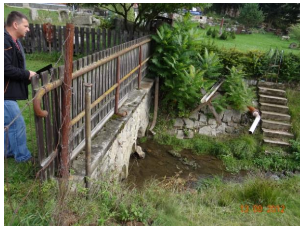
Nátok na zanesený krytý profil.