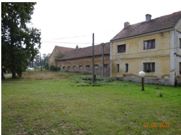
Ohrožená usedlost č.p. 10 a 11.