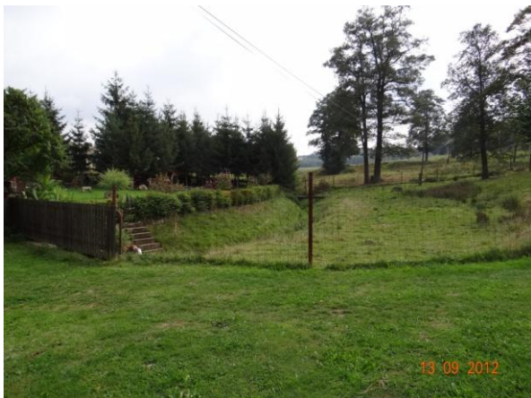
Tok nad krytým profilem.