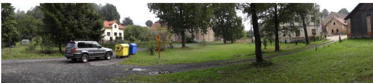
Celkový pohled na ohroženou lokalitu.