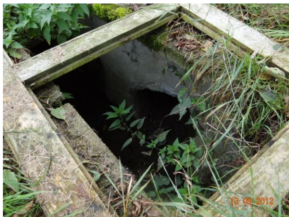
Revizní šachta na trase zatrubnění podél č.p. 10 a 11.