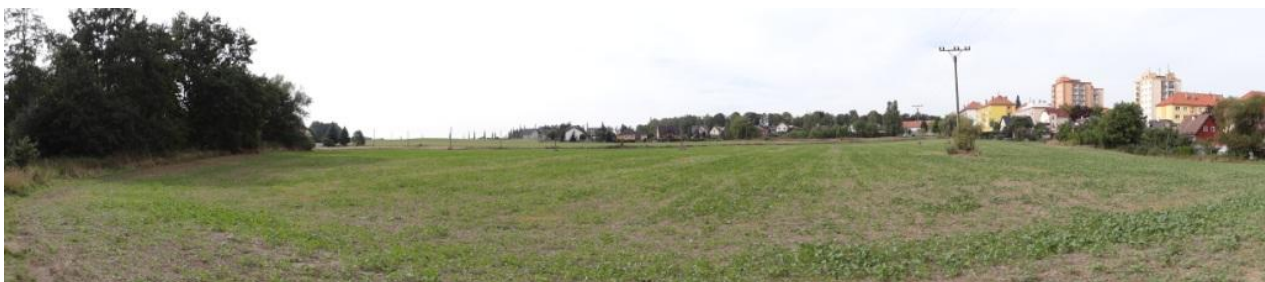
Část sběrné plochy s možností přímého ohrožení zástavby soustředěným odtokem z polí.