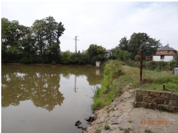
Hráz rybníka Sýkorák.