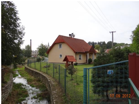
Koryto v centru Kynšperka.