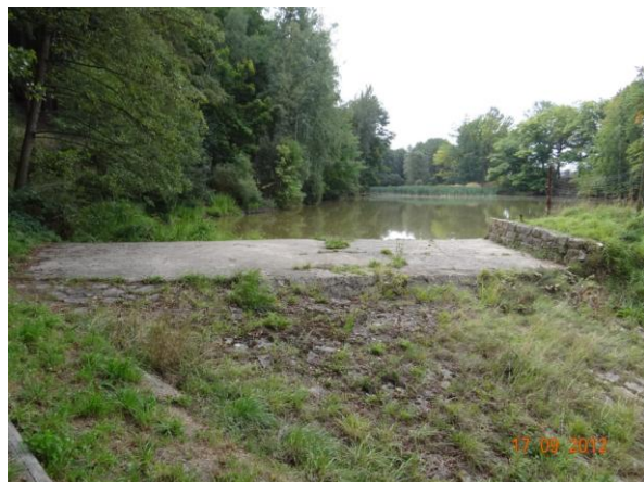
Bezpečnostní přeliv rybníka Sýkorák.