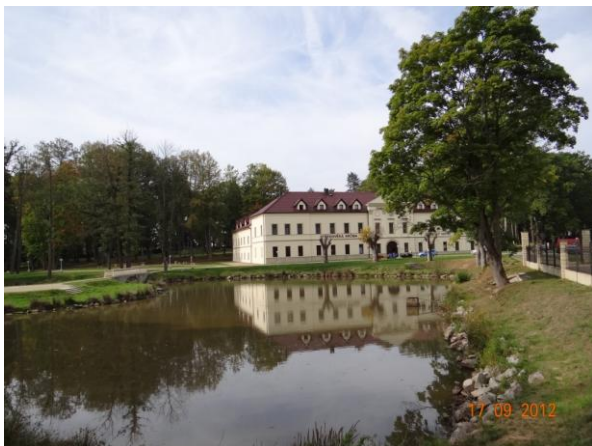
Ohrožený areál zámku Kamenný dvůr ve sběrné ploše, místo rozlivu.