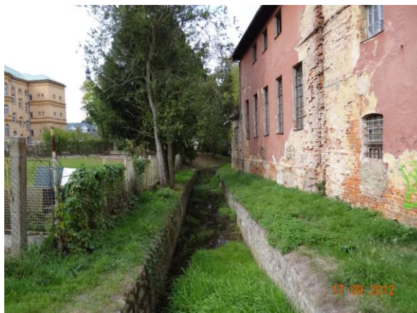
Koryto v centru Kynšperka.