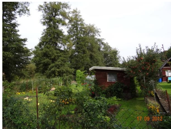
Zahradkářská kolonie pod kritickým bodem.