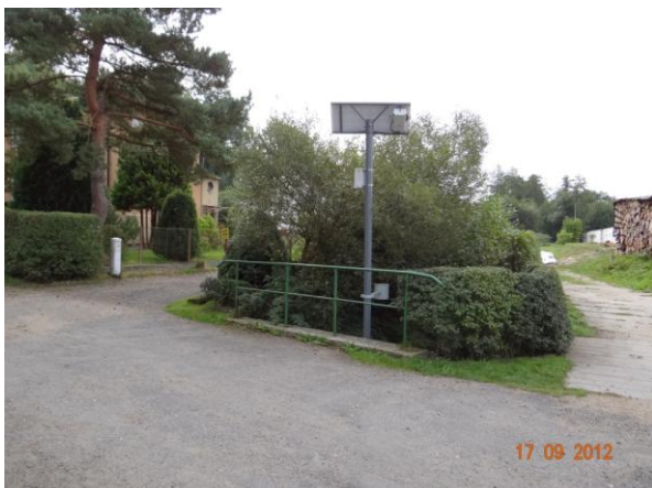
Automatický hlásný profil na mostku u garáží.