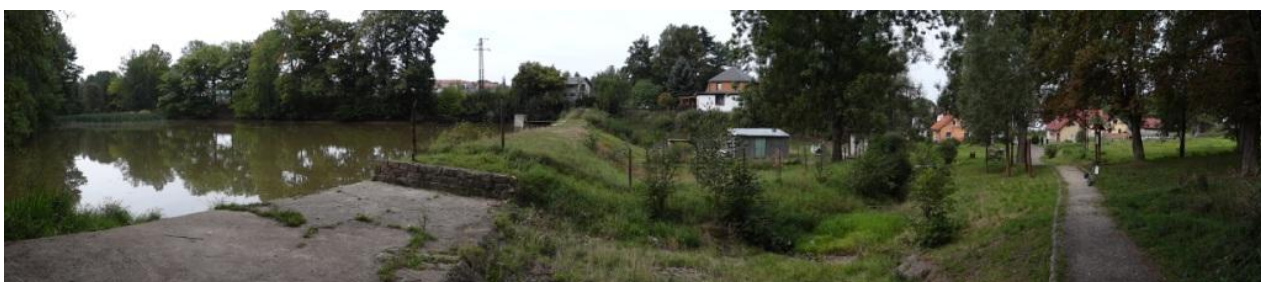
Ohrožená lokalita rybníka Sýkorák.