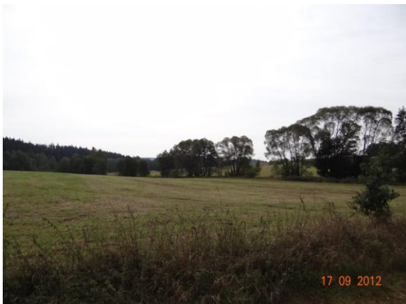
Sběrná plocha nad kritickým bodem.