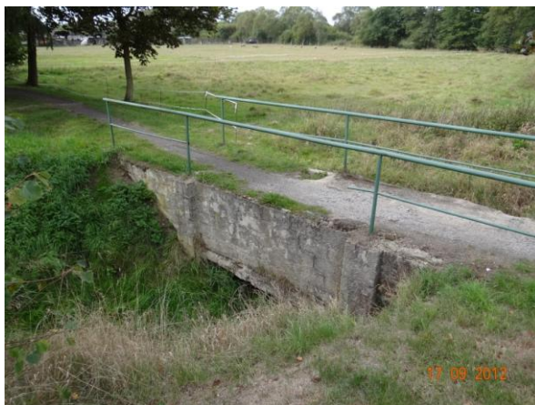
Nekapacitní profil pod č.p. 740.