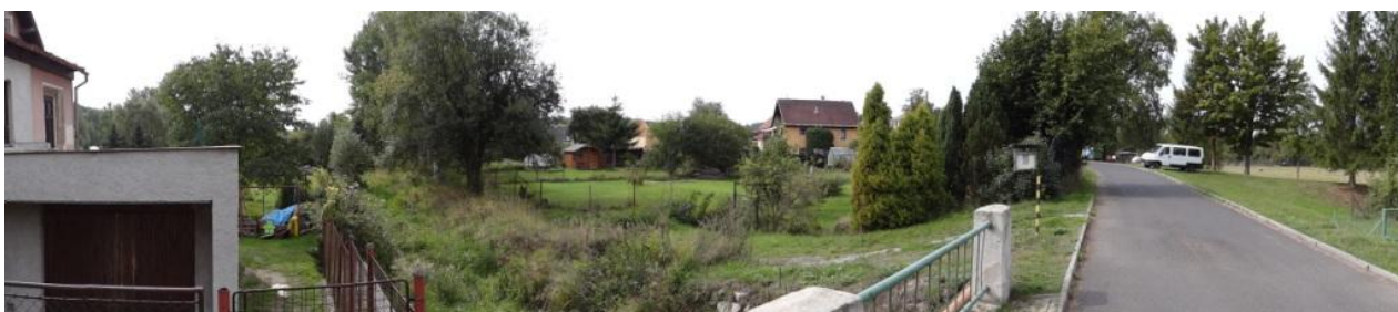
Celkový pohled na ohroženou zástavbu u č.p. 740.