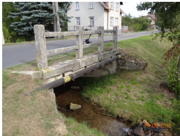
Most u č.p 709.