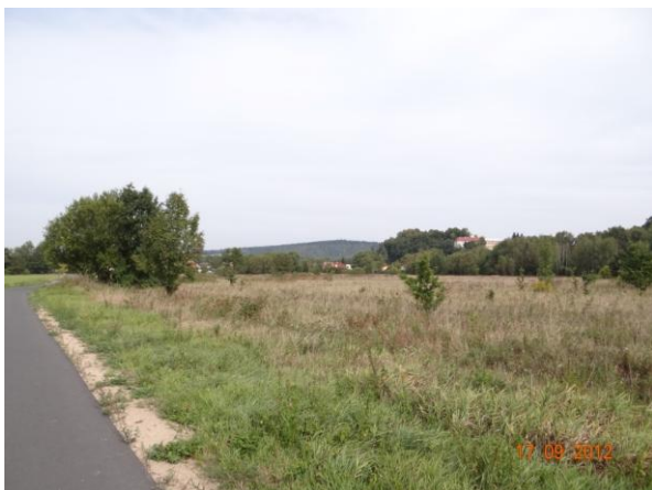
Plochá niva v lokalitě u pískovny. Možnost neškodných rozlivů.