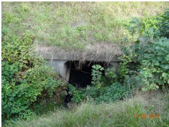
Detail propusti v tělese komunikace.