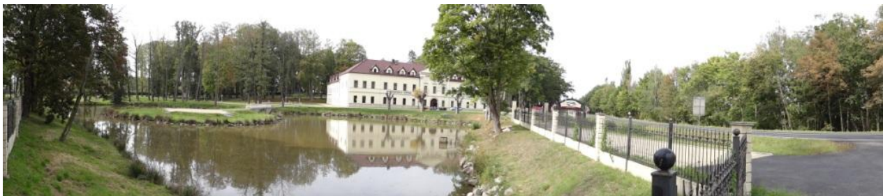
Celkový pohled na areál záměčku.