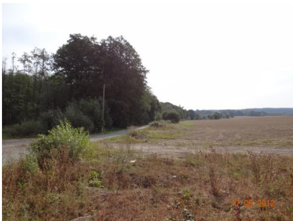
Sběrná plocha nad dálnicí.