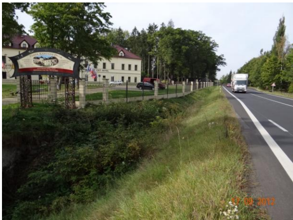
Komunikace a příjezdová cesta k záměčku - místo křížení s tokem.