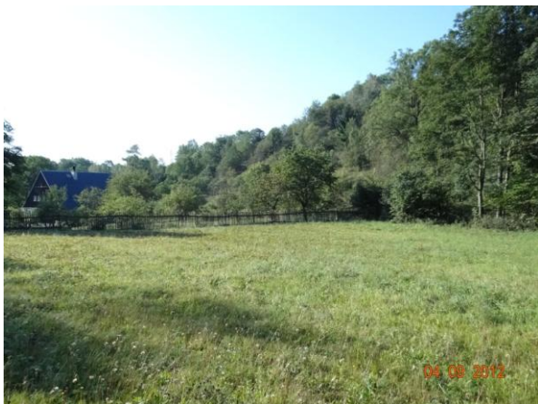
Niva toku nad kritickým bodem .