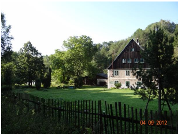
Ohrožená nemovitost v Roklí č.p. 22.