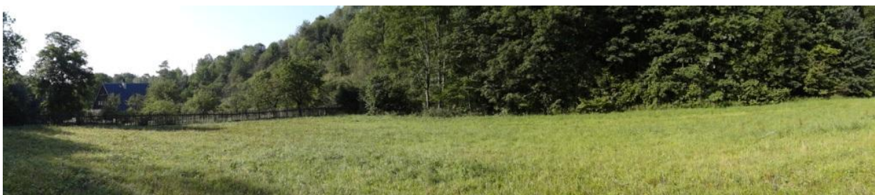
Celkový pohled na lokalitu kritického bodu.