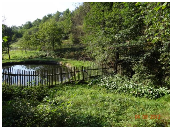
Plot přes koryto u č.p. 22.