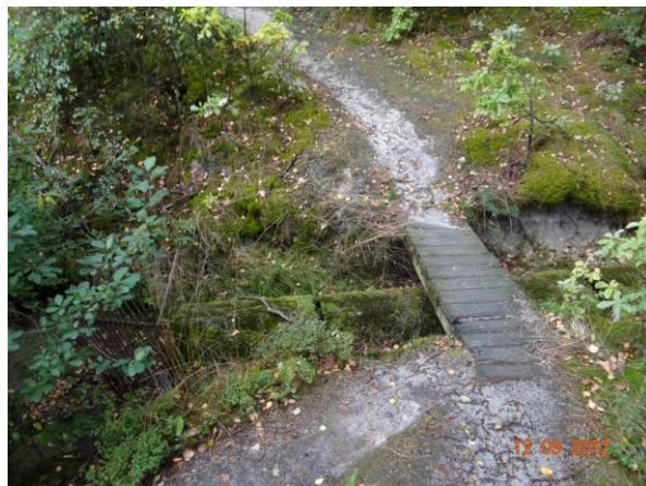
Hrazený přepad z lomu.