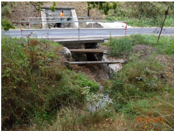
Silniční a železniční propusti na Lužním potoce ve Velkém Luhu.