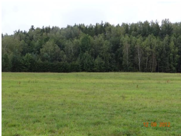
Lužní potok pod Velkým Luhem - místo neškodných rozlivů.