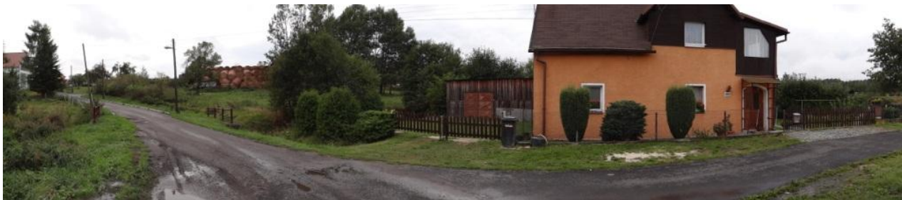
Ohrožená lokalita č.p. 86 v Křižovatce.