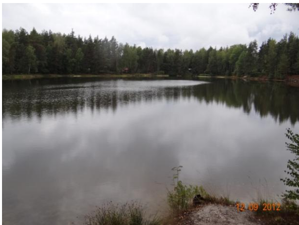
Zatopený lom ve Velkém Luhu.