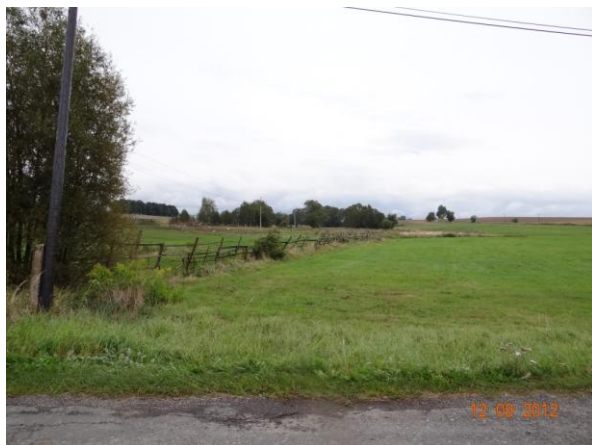
Tok pod statkem.