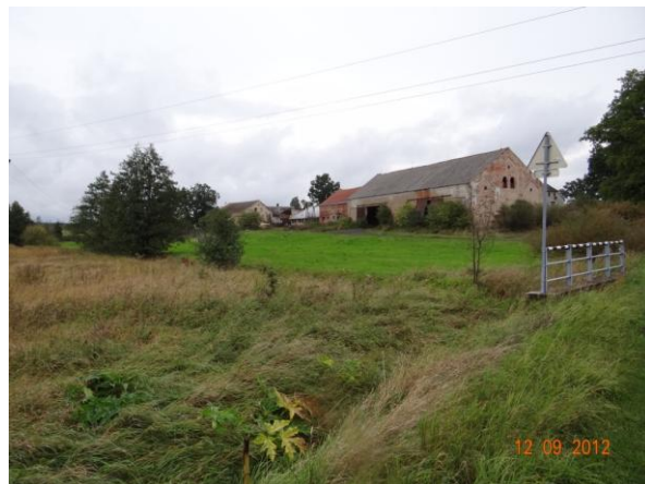
Most pod statkem.