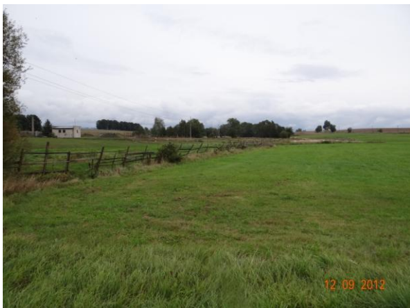
Pohled do sběrné plochy nad kritický bod.