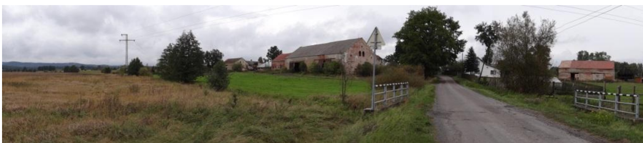
Celkový pohled na lokalitu pod statkem.