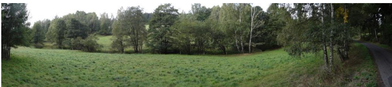
Niva toku nad Větrovem.