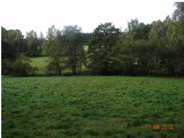
Niva toku nad areálem Větrov.