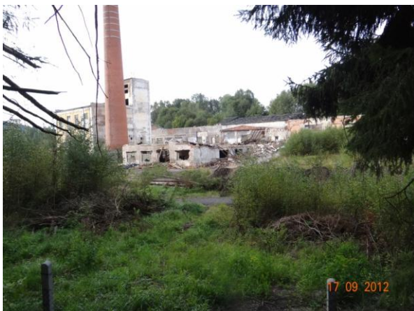
Zdevastovaný průmyslový areál.