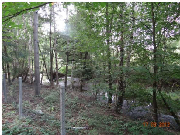
Koryto pod vyústěním krytého profilu v areálu.