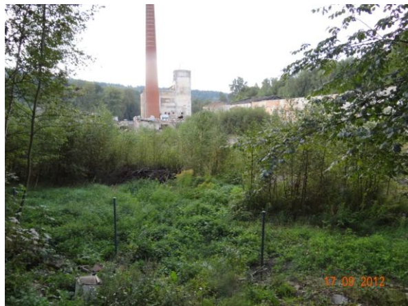
Ohrožený zdevastovaný průmyslový areál.