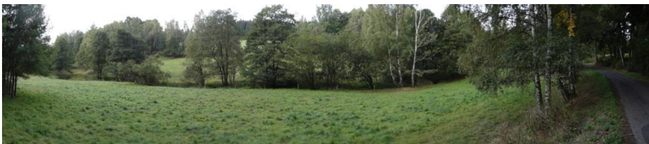
Niva toku ve sběrné ploše.