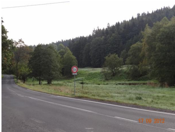
Ústí toku do Ašského potoka.