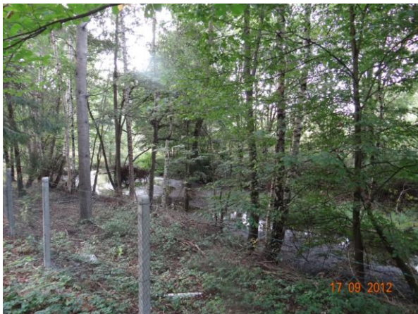
Koryto pod vyústěním krytého profilu v areálu.