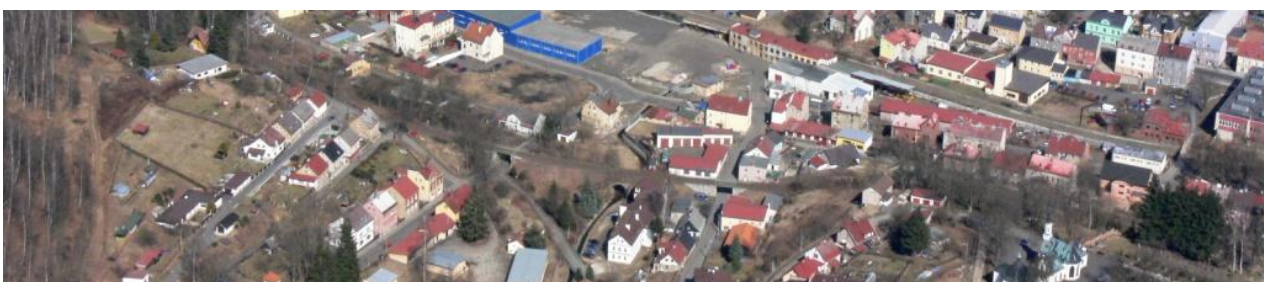
Celkový pohled na ohroženou lokalitu ústí Kamenného potoka do Svatavy.