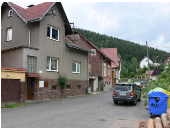
Ohrožená ulice U Potoka. Nebezpečím je skladovaná kulatina.