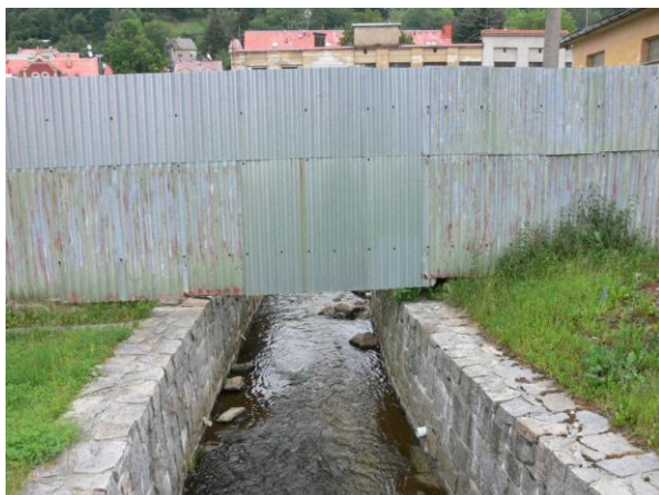
Plot areálu IMTESA přes koryto Kamenného potoka.