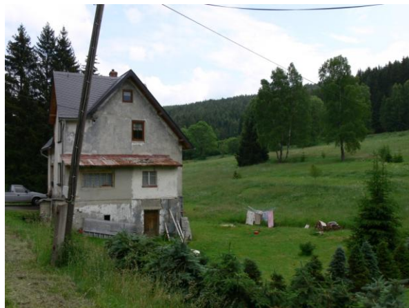
Ohrožený objekt č.p. 144.