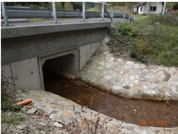
Nově rekonstruovaný most nad č.p. 125.