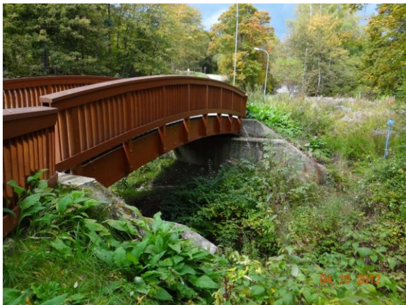
Dřevěná lávka pro pěší.