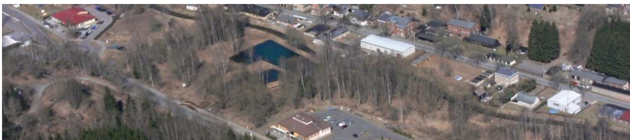
Celkový pohled dna koupaliště a okolí.