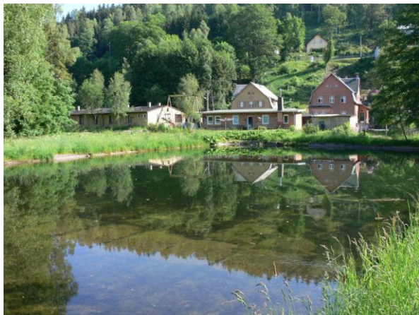
Ohrožené nevyužívané koupaliště.