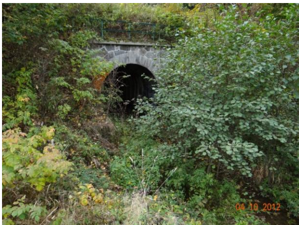
Železniční viadukt nad mostem 210-038.