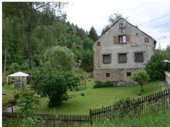
Ohrožené rodinné domy.