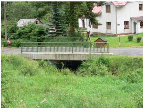
Most 218-005 s automatickým hlásným profilem.