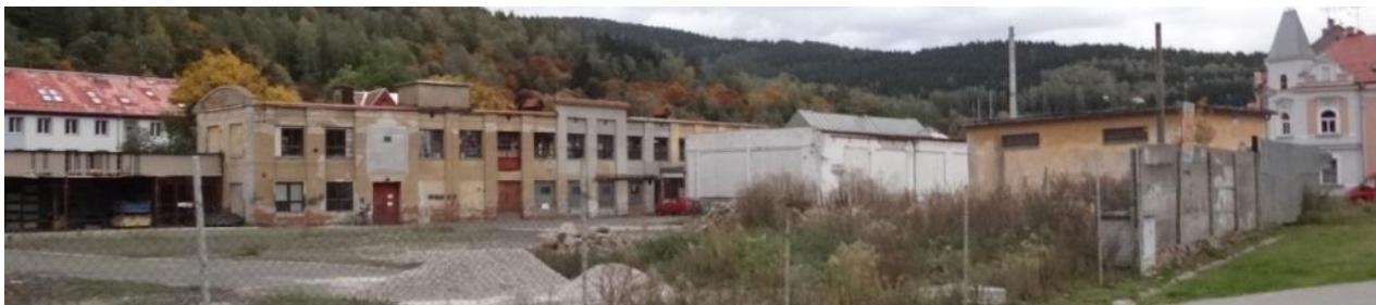
Ohrožený areál IMTESA.