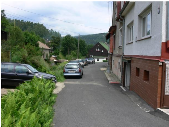
Ohrožená ulice U Potoka.