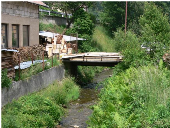
Detail mostu v ulici U Potoka. U mostu skladována kulatina, hrozí odplavení.