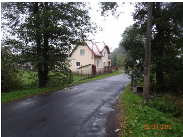
Ohrožený objekt č.p. 43.