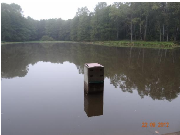
Sportovní rybník v Krajkové nad areálem XAVER.