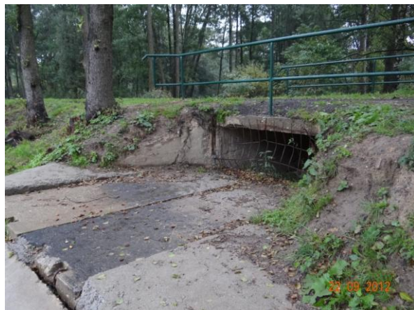
Bezpečnostní přeliv - nátok hrazen mříží proti úniku ryb.