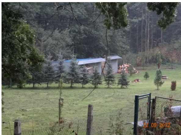
Zahrada č.p. 44 s ohroženými doplňkovými objekty.