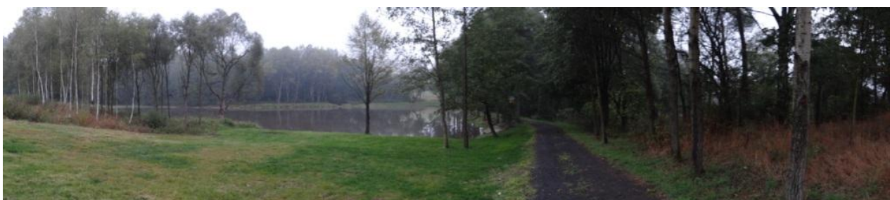
Celkový pohled na rybník.