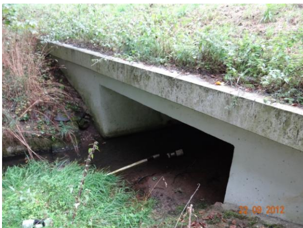
Detail mostu 21233-3.