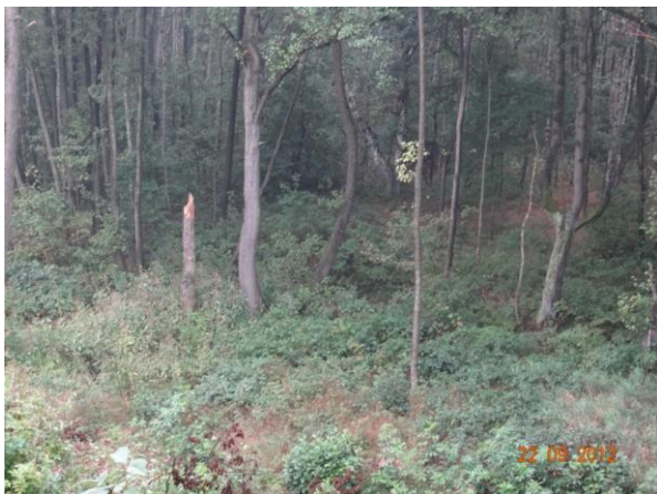
Habartovský potok v místě kritického bodu pod zástavbou rodinných domů.