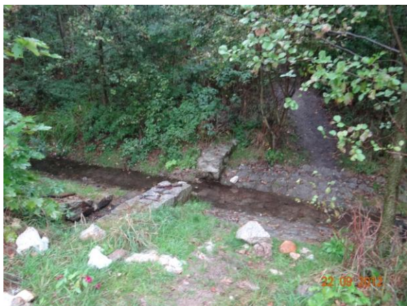
Odběr vody na Habartovská jezera.