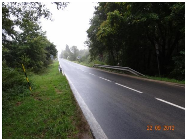
Komunikace III/21233 s mostem 21233-3.