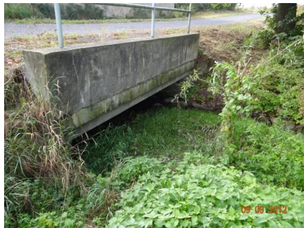
Detail nízké mostovky mostu 2262-1. Dojde minimálně k zahlcení.