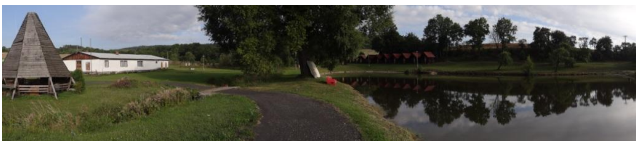
Pohled na rekreační areál v Kostrčanech ve sběrné ploše bodu. Zde dojde k masivním rozlivům.