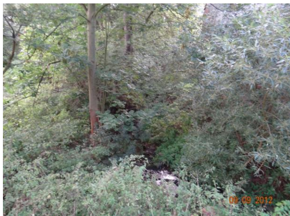
Koryto Blšanky pod mlýnem.