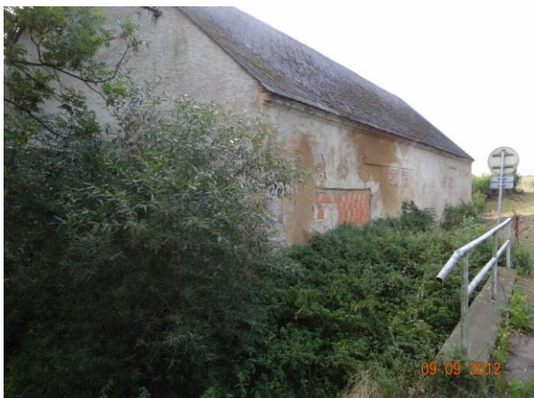
Ohrožený objekt Petrova mlýna.