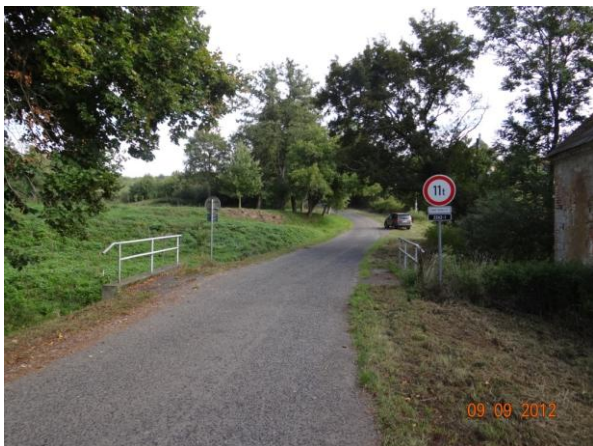
Lokalita Petrova mlýna - most 2262-1.