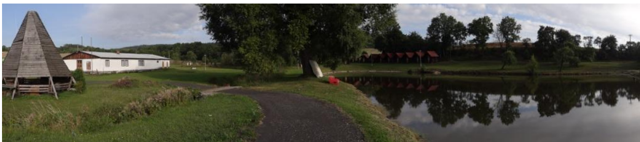
Celkový pohled na rekreační areál (č.p.26).