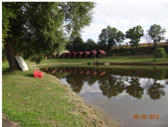
Rekreační areál a rybníkem.