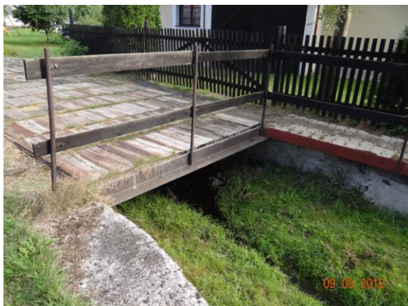
Most u ohrožených objektů č.p. 3 a 34.