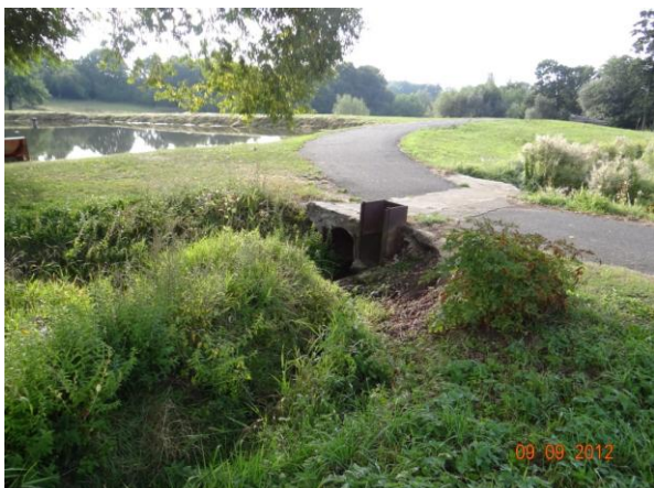
Omezující profil propusti a požeráku v rekreačním areálu. Dojde k masivním rozlivům.