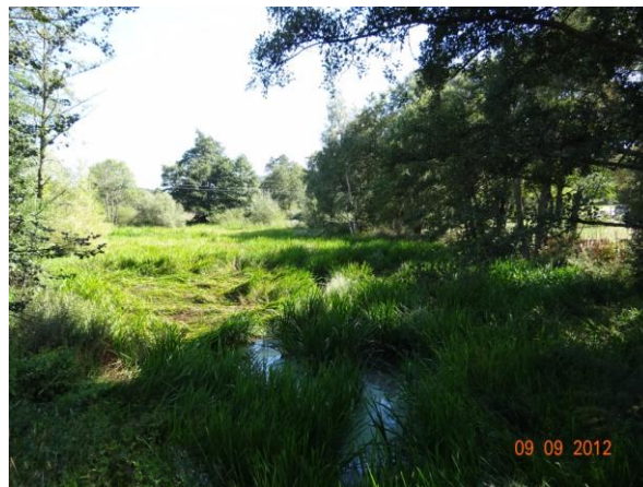
Niva nad mostem 198-032.