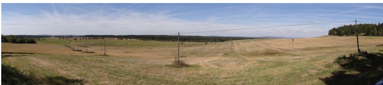
Celkový pohled na část sběrné plochy.