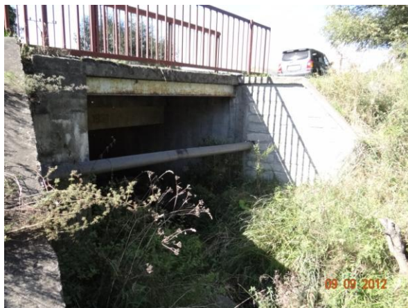
Most 198-031 s nevhodně řešeným křížením toku inženýrskými sítěmi. Dojde k záchytu splávi.