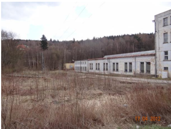
Areál Žárokovu - místo vyústění krytého profilu toku.