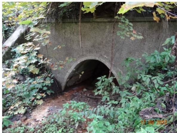
Vyústění krytého profilu pod Žárokovem.