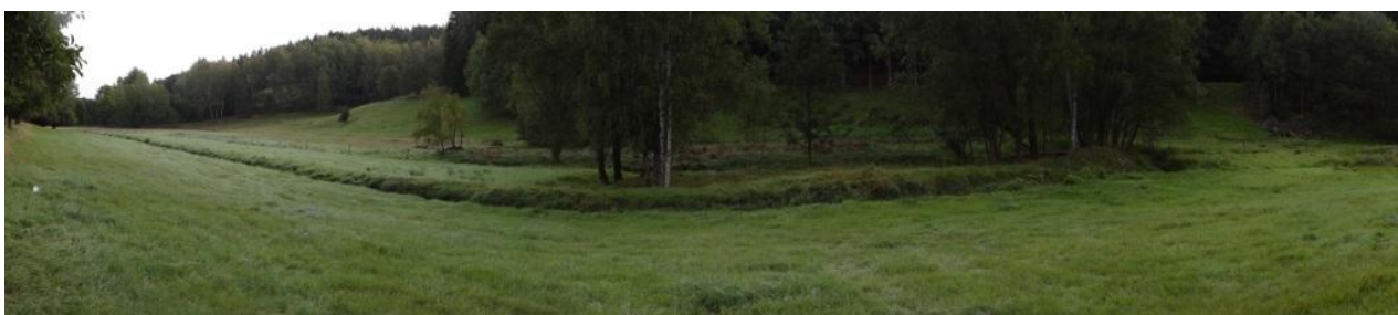
Celkový pohled na Ašský potok - úsek mezi Aší a Podhradím. Místo neškodných rozlivů