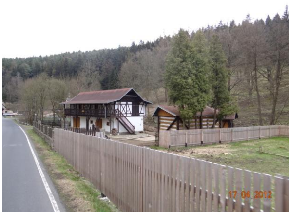
Ohrožená zástavba v Podhradí.