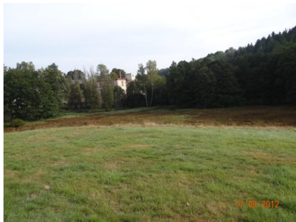
Lokalita pod kritickým bodem.