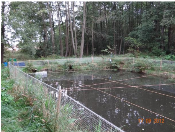
Pstruhový rybníček pod kritickým bodem - dojde k přelití do rybníčku.