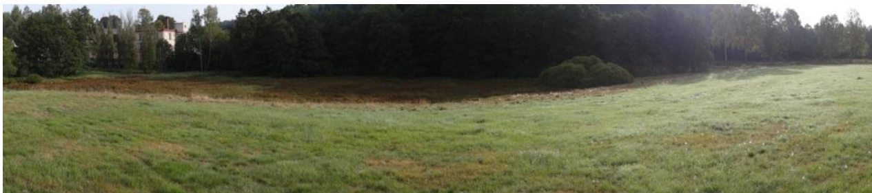
Celkový pohled na tok v lokalitě kritického bodu.