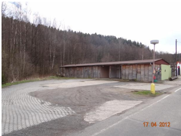
Areál pily pod soutokem s Ašským potokem.