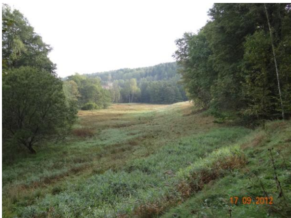
Pohled do sběrné plochy.