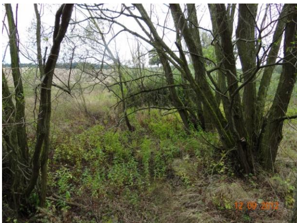
Koryto toku pod mostem.