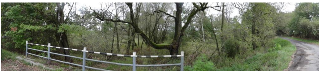
Celkový pohled na koryto nad mostem.