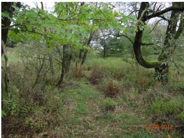
Koryto toku nad kritickým bodem.