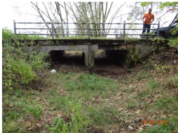
Most pod kritickým bodem.