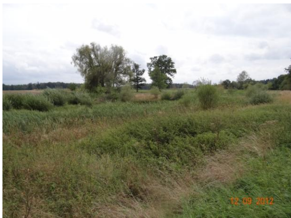
Soustava drobných nádrží.