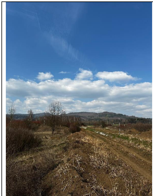
Pohled do povodí KB směrem na sever