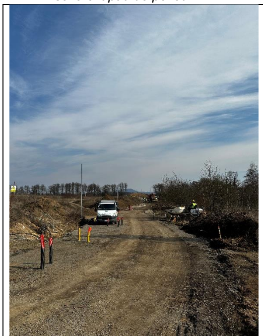
Pohled směrem na východ od KB