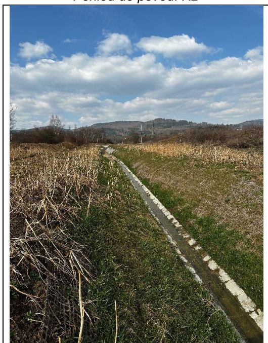
Bezejmenný vodní tok v okolí KB