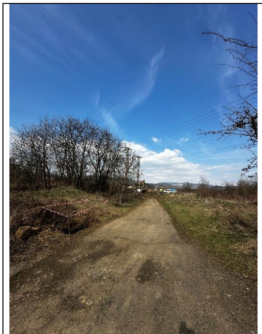
Pohled do povodí KB