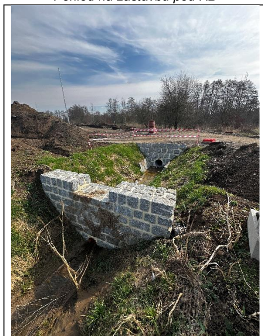
Zatrubnění bezejmenného vodního toku