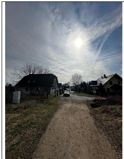
Pohled na zástavbu pod KB