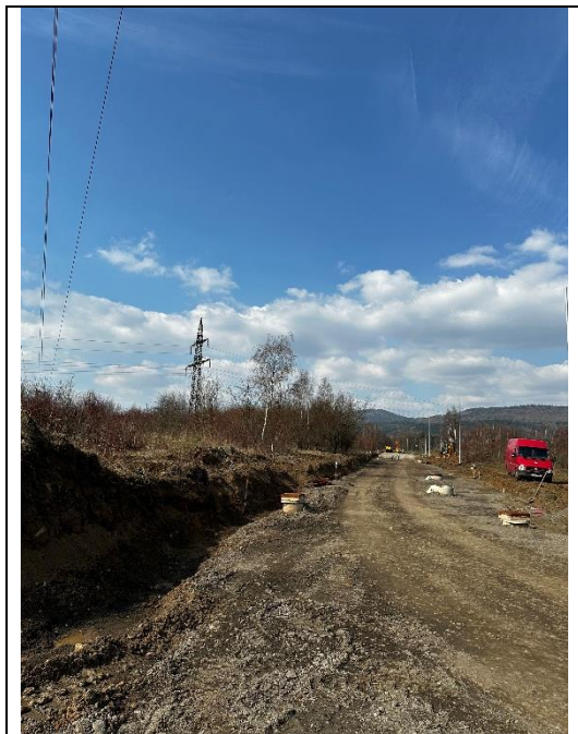
Stavba v okolí KB, pohled směrem na severozápad do povodí KB