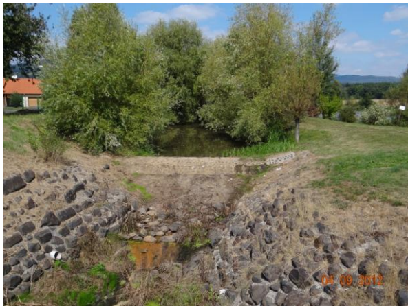
Obtok Kfelského rybníka.