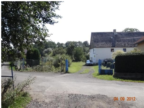
Ohrožená nemovitost č.p. 15.