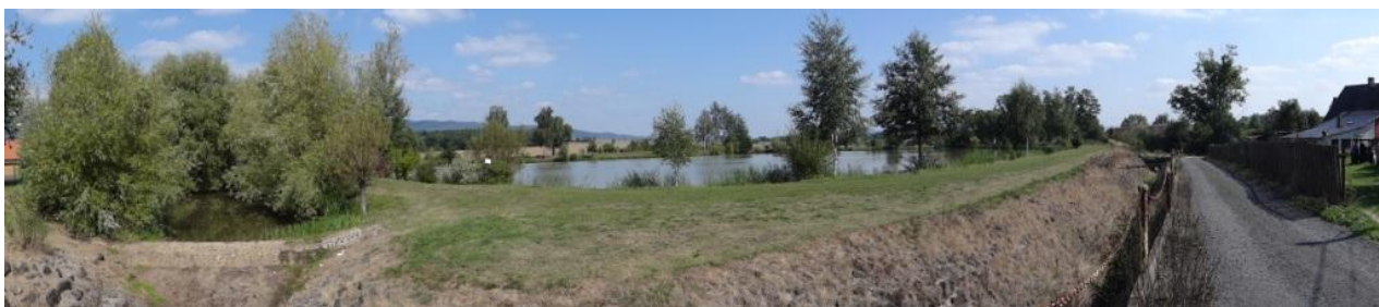
Kfelský rybník s obtokem podél hlavní čelní hráze.