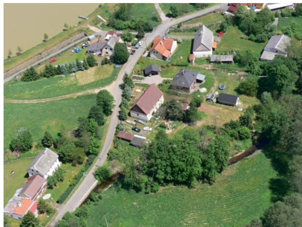
Ohrožená lokalita pod Kfelským rybníkem.