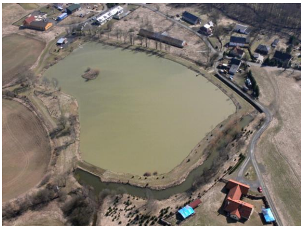
Kfelský rybník s obtokem.