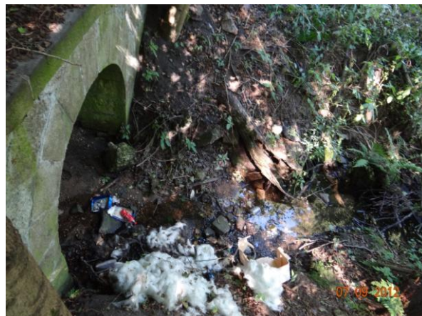
Nekapacitní profil nad Březovou - dojde k přelítí komunikace.