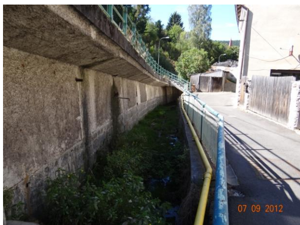
Koryto toku v Keramické ulici. Ohroženy rodinné domy.