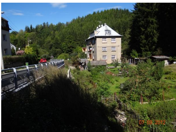
Ohrožená bytová zástavba v Březové (č.p. 145).