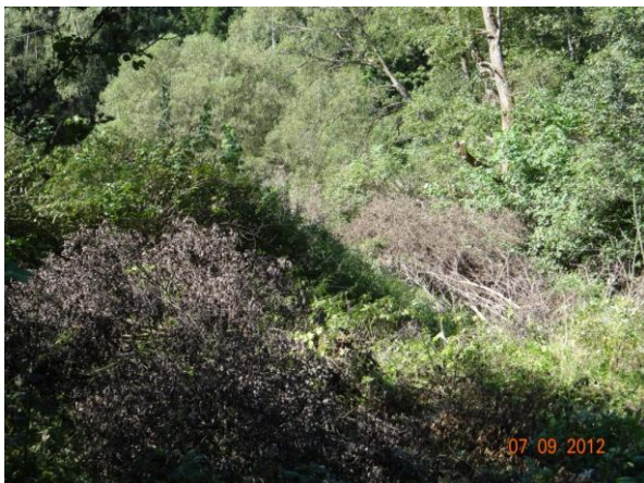
Ponechaný výřez koryta Cínového potoka nad Březovou.