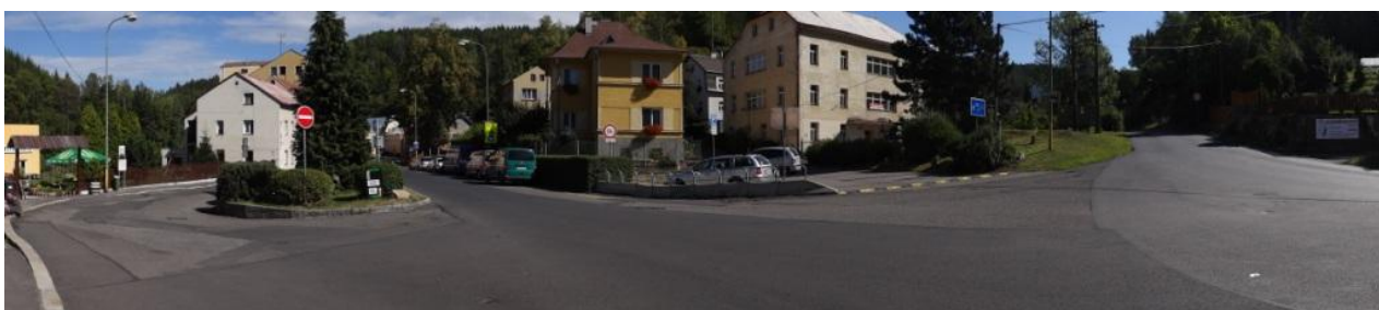
Ohrožené nemovitosti pod školou (krytý profil toku).