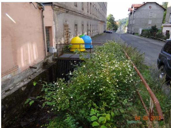
Nátok do krytého profilu (česle) - kritické místo pro Jáchymov.