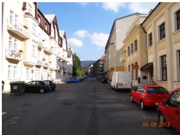
Ulice K Lanovce - trasa proudění při vybřežení nad krytým profilem.