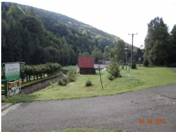
Ohrožený rekreační areál Pod lanovkou.