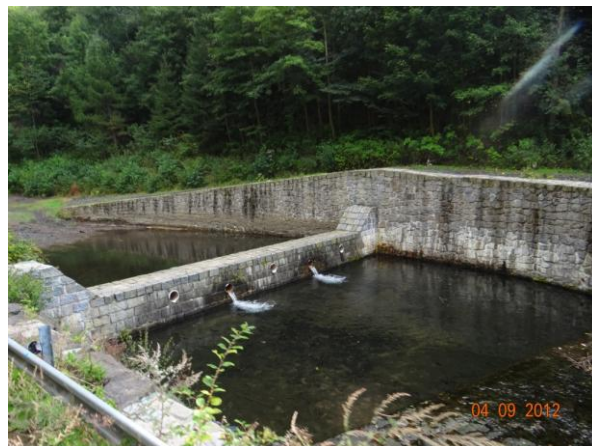
Štěrková přehrážka nad Jáchymovem.