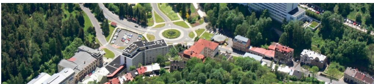
Celkový pohled na ohroženou lokalitu ulice K lanovce a kruhového objezdu.