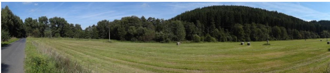
Celkový pohled na ústí DVT do toku Střely.