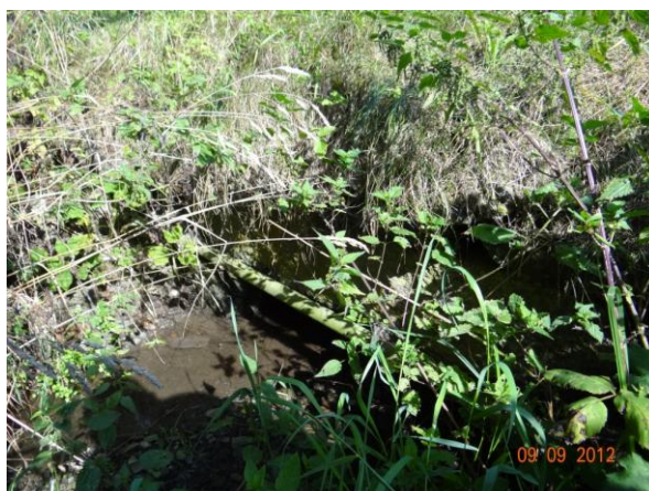
Zanesená silniční propust - dojde k přelití komunikace.