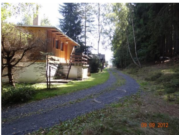
Odříznuté rekreační objekty. K zaplavení by nemělo dojít.