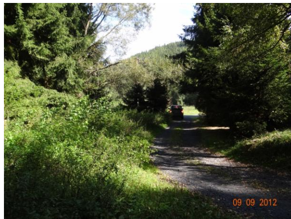
Příjezdová cesta k rekreačním objektům. Bude zaplavena.