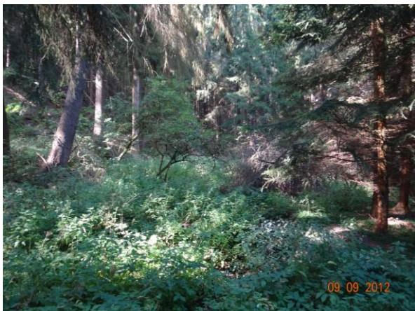
Koryto toku ve sběrné ploše.