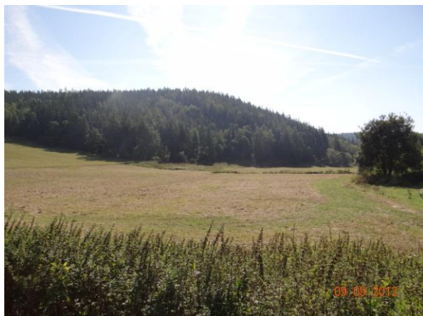
Levobřežní niva toku, kam bude směřovat rozlív.