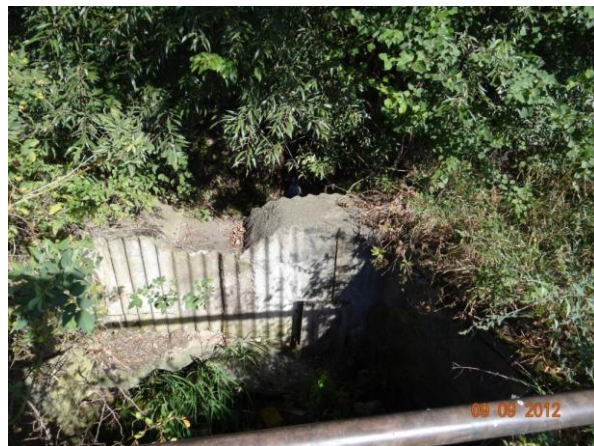
Původní objekt přelivu rybníka.