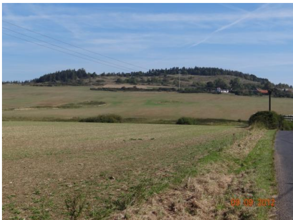
Část sběrné plochy nad kritickým bodem.