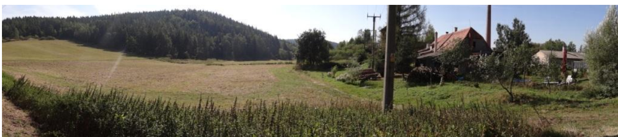
Celkový pohled na ohroženou lokalitu.