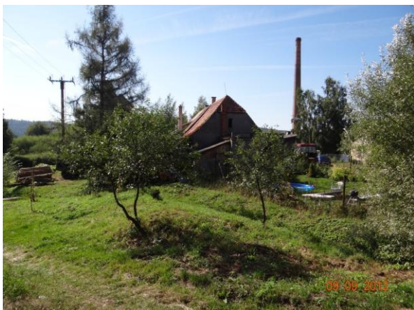
Ohrožený objekt č.p. 23.