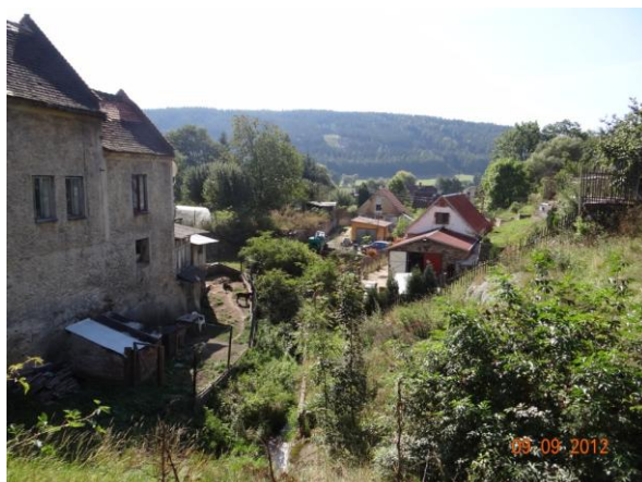
Ohrožena obytná zástavba v dolní Chyši.