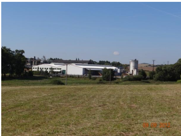
Areál pily pod kritickým bodem. Nebude ohrožen.