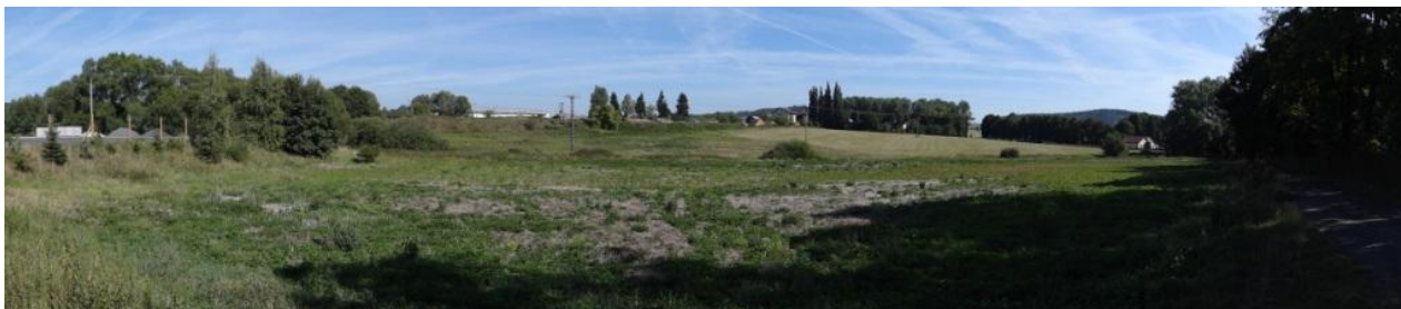
Niva toku pod areálem pily.