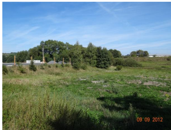
Skladovací plochy pily na navážce. Tok kopíruje navážku, k rozlivům dojde pod areálem.