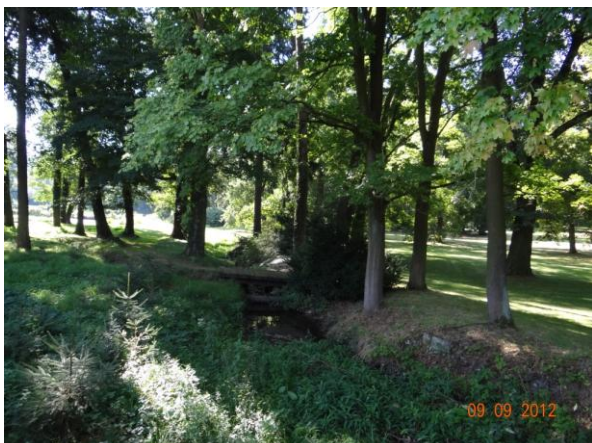
Koryto toku v parku.